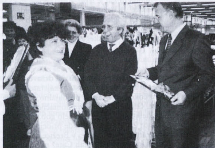
■ V proizvodnji pa so šivilje pripravile gostu iz Nemčije zelo tople sprejem in se mu tudi tako zahvalile za pozornost in spominsko darilce, ki so ga bili deležni prav vsi.