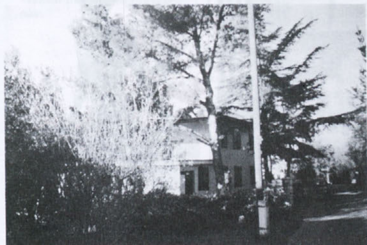
■ V hudem neurju v Savudriji je izravan bor poškodval streho nad verando našega počitniškega doma. Fantje iz splošne službe so s hitro akcijo rešili težave.

Mednarodni natečaj za najboljši časopis, na katerem je letos prvič sodelovala tudi Slovenija, vključuje več kriterijev, najpomembnejša pa je seveda vsebina. Letos je Slovenijo predstavljal v tej mednarodni konkurenci časopis in revij časopis Mercator in dobil izredno visoke ocene. Doma se je gotovo marsikdo ustrašil in se zamislil, ali je »korektno pisati o svojem« podjetju tako kritično, kot je v uvodniku zadnje (in v vseh prejšnjih) številke napisala urednica Mercatorja. Pogumni se soočijo s svojimi napakami in pošteno je zapisati vse pluse in tudi vse minuse. Taki so tudi časopisi podjetij in družb v Evropi, vsaj tistih, ki so preživeli in ki celo napredujejo. Pravijo pa, da so imela slaba podjetja tudi slabe časopise ali pa jih sploh ni bilo. Ne glede na to, ali gre za privatne ali državne družbe in podjetja, jih ima večina svoje časopise. Nekateri delajo le-te preko agencij, drugi povsem samostojno. Skratka, zelo je poskrbljeno za pretok informacij, za to, da se »podobe na ogled postavi«.