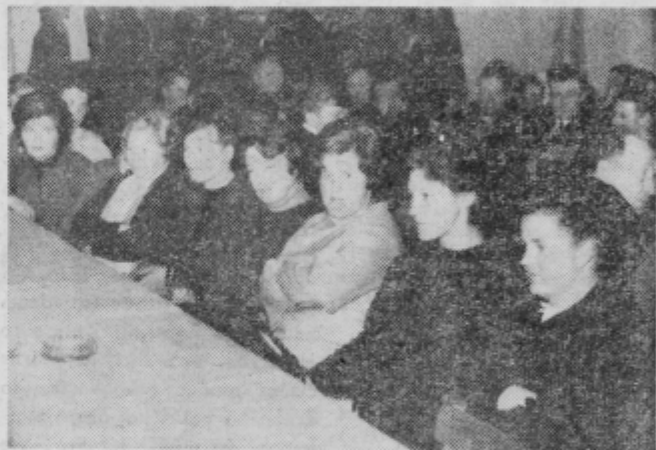
S sindikalnega občnega zbora »Petovie«

V razpravi so člani sindikata obsojali tudi najmanjše nepravilnosti v poslovanju, planiranju dela, zavedajoč se,