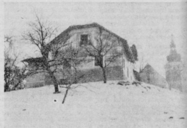
Clani lovske družine Bresnica se ponašajo z lepim domom.

Vsem bresniškim »jagrom« lovski zdravo in v prihodnji sezoni — dober pogled in čim manj »krivih« cevi. J. S.