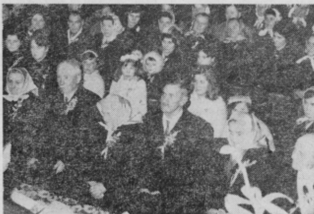
Trojna zlata poroka v Markovcih