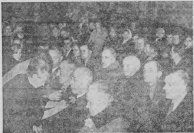
Ustanovni člani GD Gorišnice

Leta 1966 so slavili sprejem nove motorne brizgalne. Leta 1967 je društvo gospodarsko in tehnično najbolj napredovalo; dobilo je nov gasilski avto. Od podeželskih društev so danes najbolj opremljeni. Za vse to je treba pohvaliti neumorne člane, mnoge gospodarske in družbeno politične organizacije, občinsko GZ, SO Ptuj, vse vaščane in mnoge druge, ki so kakorkoli pomagali.