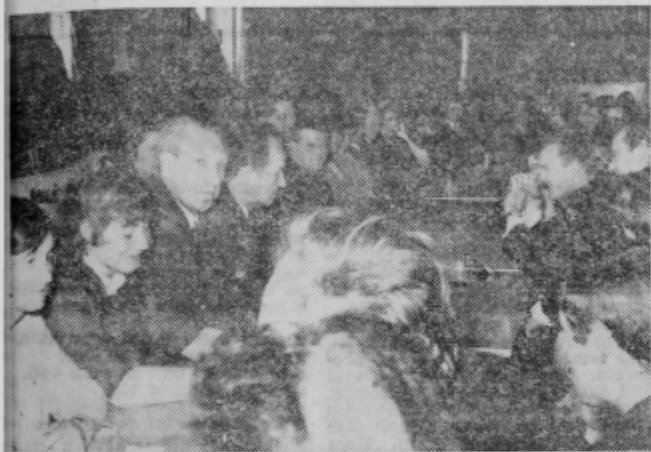
Z občnega zbora sindikata TVI Majšperk

plan. Večkrat so delali ob sobotah in nedeljah. Težave so bile z uvoženimi surovinami. Plan proizvodnje so presegli tudi v tkalnici. K boljšim uspehom so pripomogli tudi novi stroji, ki so z visoko turažo prinesli več metrov in večji dohodek. Proizvodnja povečujejo tudi s sodelovanjem s kooperanti. Nakazal je še nekatere pomanjkljivosti, ki jih bo treba odpraviti.