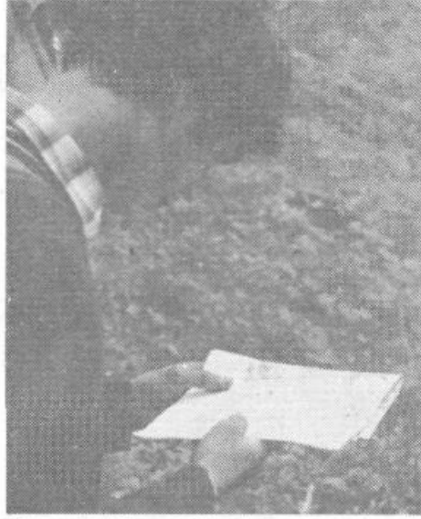
Kam sedaj? Karta tudi vedno ne pove vsega in znajti se moraš sam.