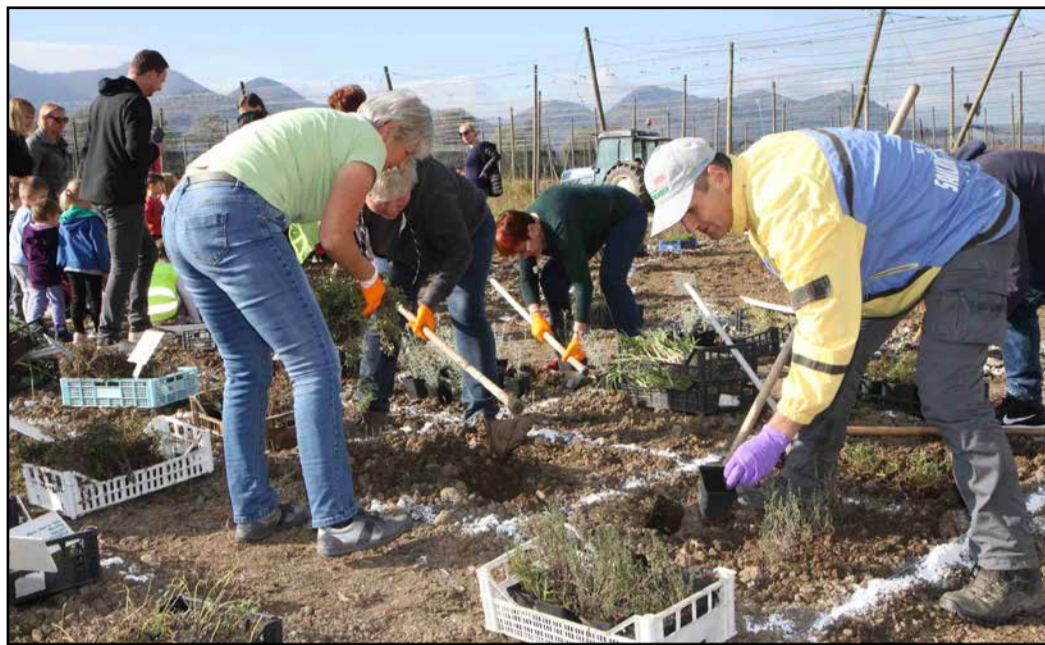
Zivahno na delavnicah vrta zdravilnih in aromatičnih rastlin