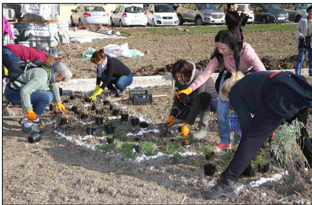
Praktična delavnica je odlična priložnost za pridobivanje novih znanj na področju zelišč.

Vrt zdravilnih in aromatičnih rastlin na Inštitutu za hmeljarstvo in pivovarstvo Slovenije je bil ustanovljen leta 1976 z namenom, da IHPS postane center za pridelavo, predelavo in uporabo zdravilnih rastlin v Sloveniji, kar mu je s svojim dolgoletnim obstojem vsekakor uspelo. Po več kot 40-letnem obstoju pa se je pokazala potreba po drugačni, bolj sodobni ureditvi VZAR kot osrednje povezovalne točke na področju pridelave in uporabe zelišč ter prostora za spodbujanje družbene in socialne vključenosti različnih skupin prebivalstva.