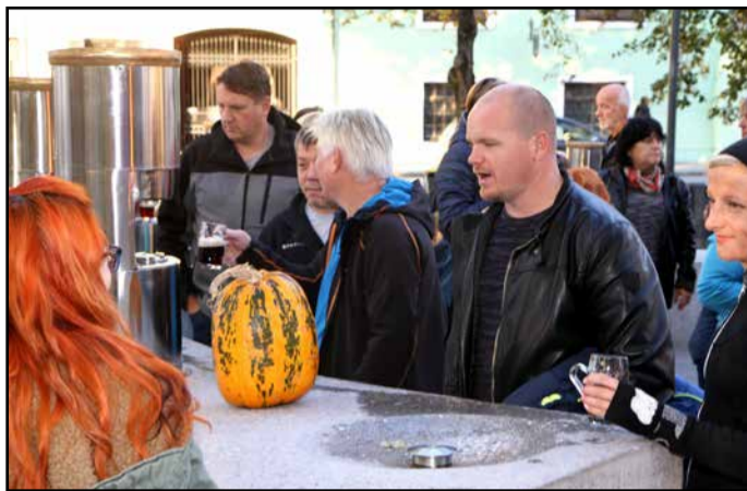
Obiskovalci so se zanj dan razveselili tudi dodatne degustacije na fontani piv.

V sredo, 31. oktobra, na dan reformacije, so v Žalcu sklenili tretjo sezono delovanja Fontane piv Zeleno zlato. Ob tej priložnosti so poskrbeli za pestro celodnevno dogajanje. Dopoldne so pripravili čarovniško tržnico in poskrbeli za čarovniško rajanje, popoldne pa so se obiskovalci fontane posladkali s pečenim kostanjem in