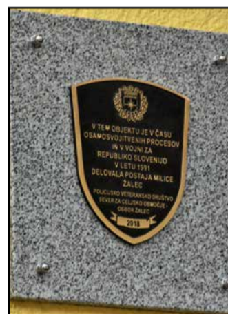
Spominska plošča na nekdanji postaji milice bo spominjala na osamosvojitveni čas.

ti, da se ohrani spomin na tiste tako pomembne čase, o katerih danes zgodovina premoledno govori, se pa vse bolj zavedamo, da so bili odločilni ali, kot radi rečemo, pika na »i« za samostojno državo Slovenijo. Plošča naj služi tudi kot opomin na te dogodke in da se takšni časi ne bi več ponovili. Za nas, ki smo bili takrat aktivno vključeni v zavarovanje teh procesov, plošča ni potrebna, ker v nas še vedno živi spomin, služila pa bo zanamcem in tistim, ki jih bo obdobje osamosvajanja Slovenije zanimalo.«