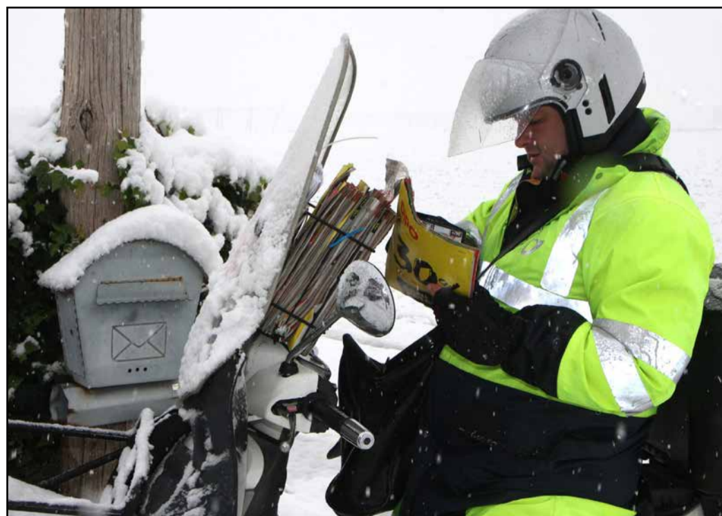
Poštna logistika zna biti ob prvem sneženju nekoliko bolj zamudna.