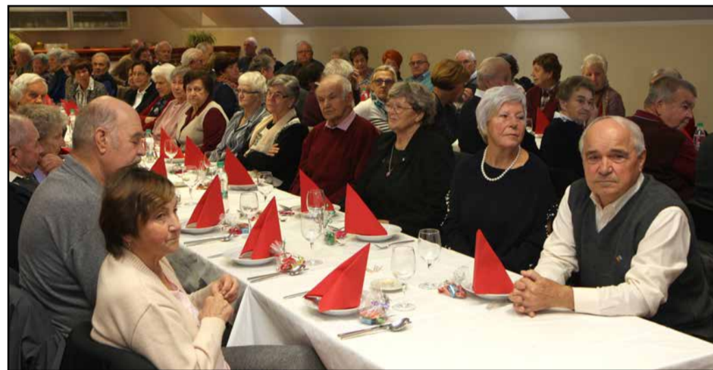
S srečanja starejših krajanov v dvorani PGD Gotovlje

KS Gotovlje in KO Rdečega križa Gotovlje sta zadnje novembrsko nedeljo v prostorih Gasilskega doma Gotovlje pripravila srečanje starejših krajanov. Od 246 vabljenih krajanov, starih 70 in več let, se je tega prijetne-