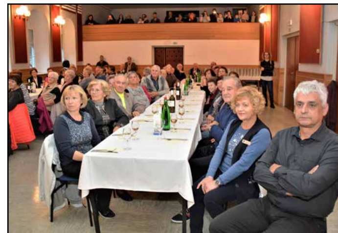
S srečanja starejših krajanov v dvorani kulturnega doma v Libojah