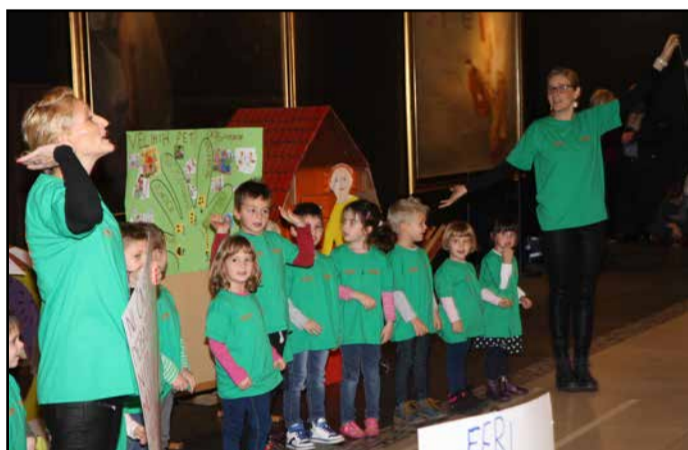
Malčki o poštenosti