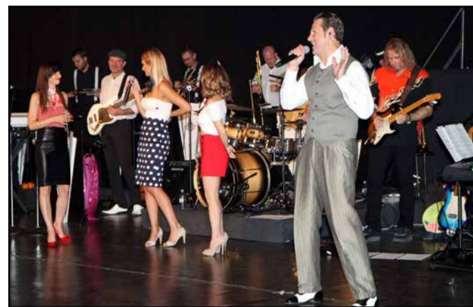
Med nastopom The Moonlighting orkestra