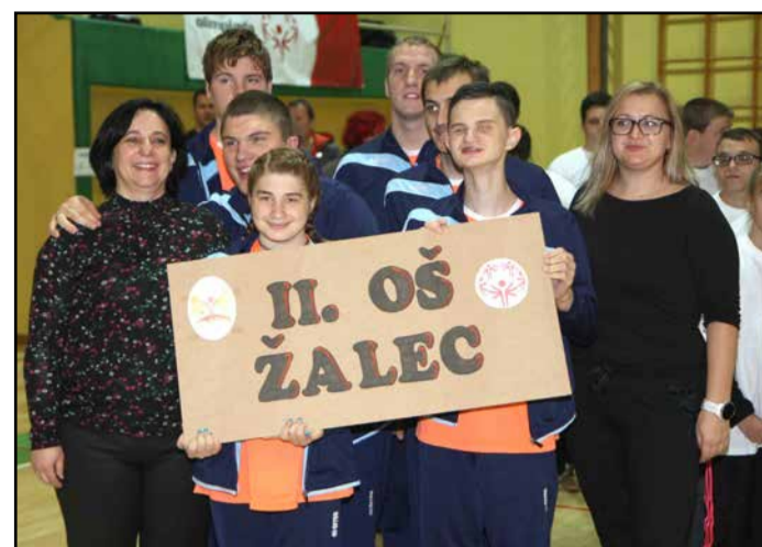
Ekipe II. OŠ Žalec je osvojila srebrno medaljo.

Srebrno medaljo so osvojili košarkarji domače ekipe II. OŠ Žalec, ZUDV Dornava, OŠ Mi- hajla Rostoharja Krško, OŠ Gu- stava Šiliha Maribor, VDC Saša Velenje in CVIU Velenje.