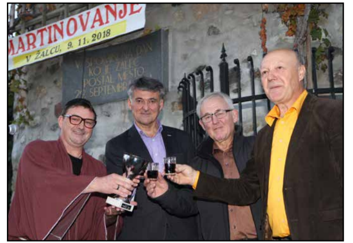
Po krstu mladega vina so takole nazdravili.