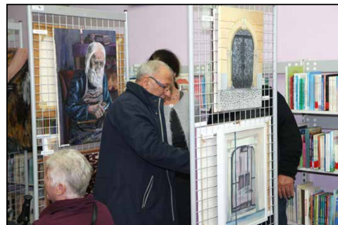
Z razstave likovnih del na temo kulturne dediščine Žalca.