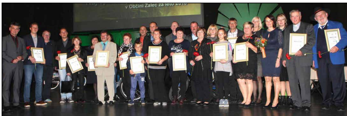
Prejemniki priznanj z županom in predsednico komisije