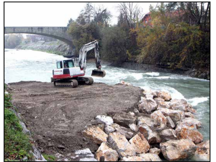
Dela pri zavarovanju leve brežine nad mostom čez Savinjo Polzela-Parižlje

Dela zajemajo zavarovanje močno erodirane leve brežine nad mostom Polzela-Parižlje dolžine 114 metrov ter čiščenje prodišča v Ločici ob Savinji v bližini športnih igrišč. Investitor je Ministrstvo za okolje in prostor, Direkcija RS za vode, izvajalec pa podjetje Hidrotehnik s podizvajalcem Nivo EKO. Vrednost del znaša 171 tisoč evrov z vključenim DDV. T. T.