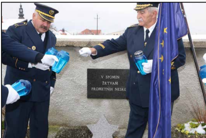
S slovesnosti v spomin žrtvam prometnih nesreč na polzelskem pokopališču

»Zavod Varna pot pod okriljem Organizacije Združenih narodov (OZN), Svetovne zdravstvene organizacije (WHO) ter Evropskega združenja žrtev prometnih nesreč (FEVR), 18. novembra obeležuje in organizira aktivnosti ob svetovnem dnevu spomina na žrtve prometnih nesreč. Ocena Svetovne zdravstvene organizacije je, da na svetovnih cestah letno umre približno 1,24 milijona udeležencev, dnevno to pomeni smrt najmanj 3.390 oseb. Poškoduje se okoli 50 mi-