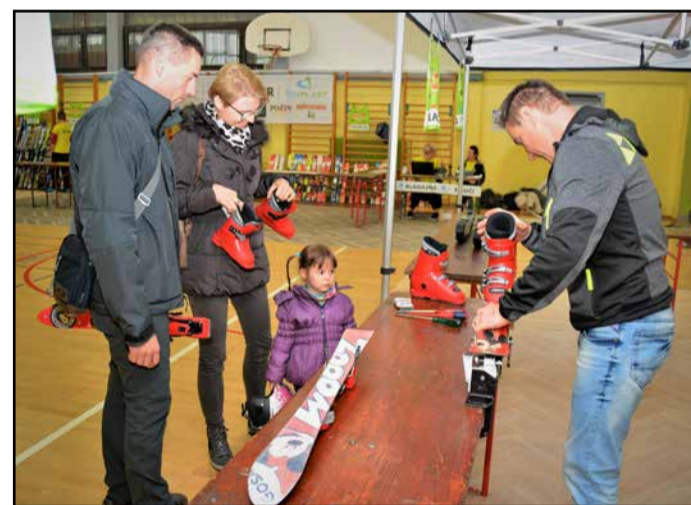
Na sejmú so poskrbeli tudi za servis smučí.

Zanimivim so nudili pomoč in svetovanje pri izbiri opreme, poskrbeli so tudi za servis smučí, organizatorji pa so smučarski sejem izkoristili tudi za promocijo svojega društva in prijetno počutje. D. N.