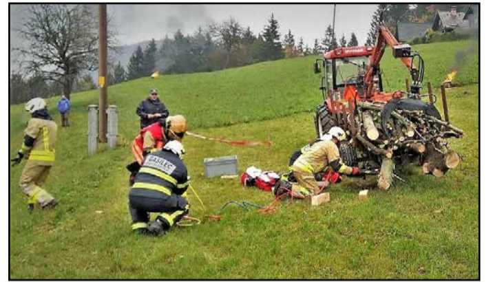
Meddruštvena vaja na Podmeji, kjer je traktorist povozil eno osebo.

Meddruštvena vaja preboldskega in trboveljskega društva je potekala na Podmeji – na travniku ob Lovskem domu LD Tr-