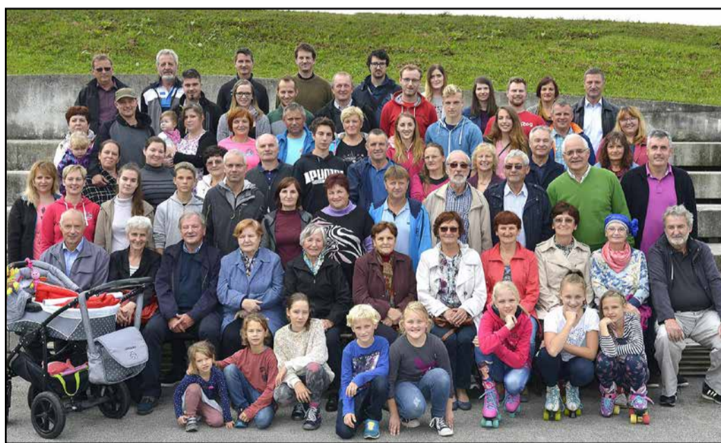
Udeleženci srečanja rodbine Praprotnik