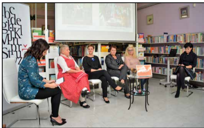
S prve prireditve v Teden splošnih knjižnic, kjer se je predstavila v okviru Utripa Domoznanstva KUD Svoboda Prebold

V knjižnici so v tem času začeli 12. sezono branja Savinjsčani beremo. Dan zatem, v sredo, 21. novembra, je bila knjižnica v znamenju evropskega leta kulturne dediščine. Ob tej priložnosti so pripravili razstavo domoznanstvenega gradiva občinskih knjižnic Žalec, Polzela in Prebold. V četrtek je knjižnica praznovala skupaj z najmlajšim, kar