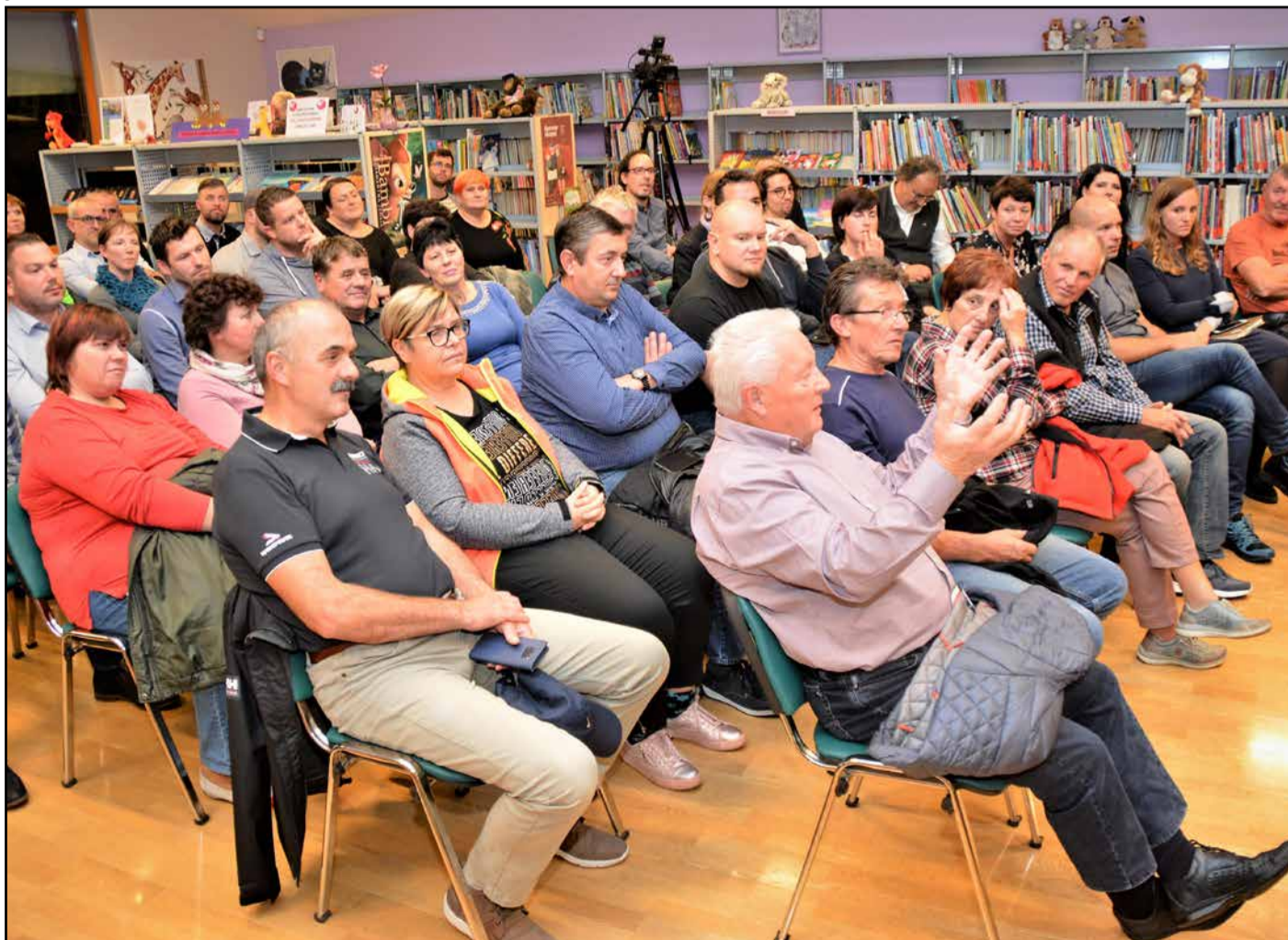
Razen v Občini Žalec, kjer je bila udeležba nekaj več kot 42-odstotna, so se drugod po dolini volivci odzvali nad slovenskim povprečjem, aktivni pa so bili povsod na soočenjih in zborovanjih.