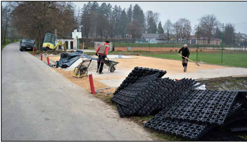
Počivališče za avtodome v Preboldu

Prebold je bil že pred 2. svetovno vojno najbolj turističen kraj v Spodnji Savinjski dolini. Kraj je imel v središču hotel, bazen in teniško igrišče, po vojni pa tudi prvi kamp s hišicami v Sloveniji. Kasneje so zgradili nov hotel, vendar je turizem, ki je pomemben del slovenskega gospodarstva, zaradi različnih vzrokov nazadoval.