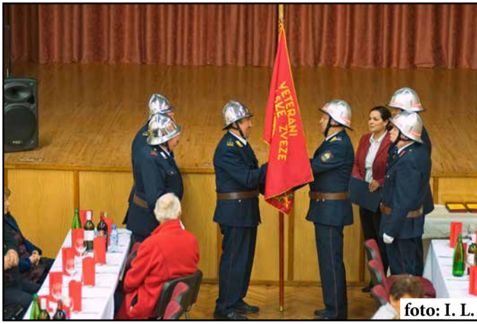
Med predajo prapora PGD Groblja

Organizatorji so srečanje popestrili s prijetnim kulturnim programom, v katerem je nastopil MPZ KD Antona Schwaba Prebold. Sledila je primopredaja prapora starejših gasilcev GZ Prebold. Leto dni so zanj skrbeli starejši gasilci