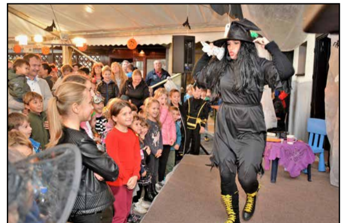
Prijetna in poučna predstava s čarovnico in skratom

Vreme je zdržalo, dežja ni bilo, povrhu vsega je bilo še precej toplo za ta letni čas, tako da gozdarski ognji, ki so jih postavili, niso prišli do prave veljave. V pestrem programu, ki ga je najprej zaznamovala prijetna in poučna predstava za otroke, je imel vsakdo veliko možnosti in veselja za prijetno doživetje, ki ga ponuja takšna prireditev. Otroci so si lahko poslikali obraz in sodelovali v animacijskem programu s sladkim presenečenjem. V