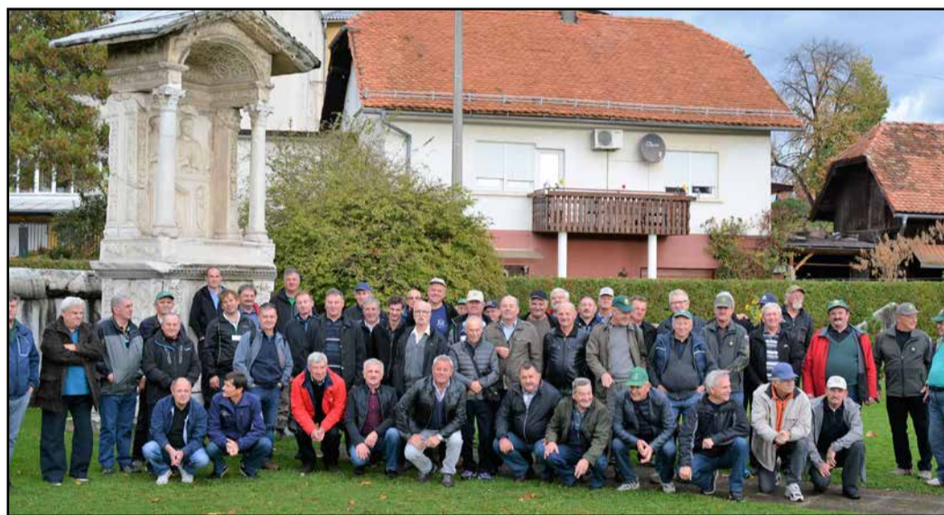
Po ogledu še skupinska fotografija ptujskih veteranov s predstavnikoma ZVVS Spodnje Savinjske doline

Takrat bo znan tudi podatek o tem, koliko ljudi je letos obiskalo jamo. Za Rimske nekropole, kjer so spomenike že zaščitili pred zimo, so v Turističnem društvu Šempeter povedali, da je antični park letos obiskalo več kot 8000 obiskovalcev, kar pomeni, da je obisk primerljiv s preteklim letom. Od tega je bilo predvsem v poletnih mesecih okoli 18 % tujih gostov, ki večinoma prihajajo iz sosednje Avstrije, Nizozemske, Belgije, Italije, Francije, Anglije, nekaj pa je bilo tudi turistov iz bolj eksotičnih dežel, kot so Brazilija, Ciper, Ekvador, Nova Zelandija, Šri Lanka. Poleg posameznikov in družin si je obe