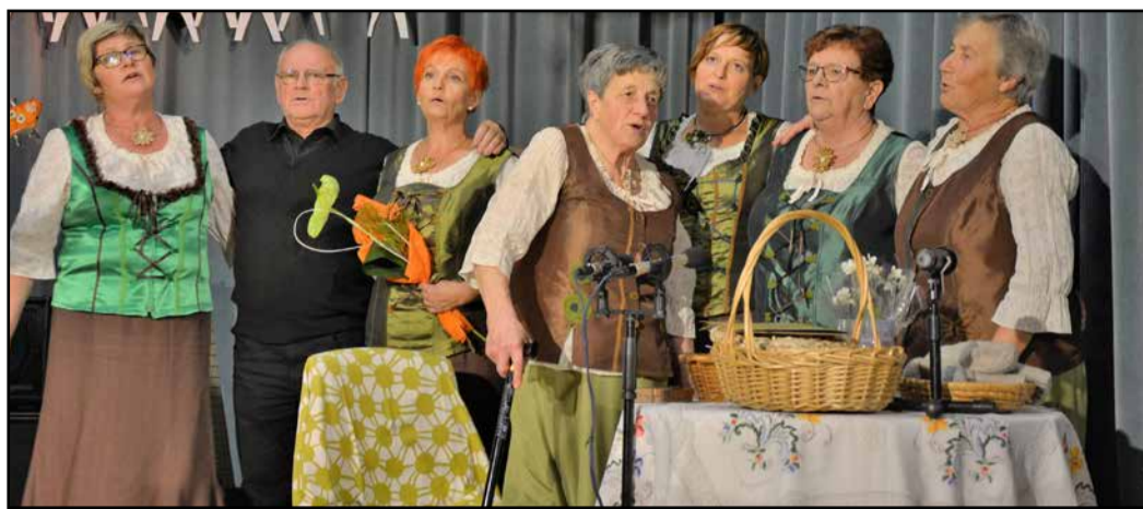
Ljudske pevke s Ponikve ob njihovem jubileju

Prva novembrska sobota je bila na Ponikvi pri Žalcu v znamenju petja in glasbe, za kar so bile zaslužne Ljudske pevke s Ponikve, ki so ta dan slovesno obeležile 20-letnico svojega delovanja. Prireditev so v Domu Antona Martina Slomška s svojimi nastopi popestrili številni gostje, pevke pa so ob tej priložnosti predstavile svojo novo zgoščenko Skupaj zbrani in knjižico s pesmimi in z razmišljanji pevk in njihovih bližnjih.