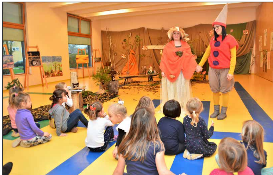
Takole so uprizorili gozd v večnamenskem prostoru prebolskega vrtca.

Vrtec Prebold že tretje leto sodeluje v inovacijskem programu Mreža gozdnih vrtcev Slovenije. Ob tej priložnosti so drugo novembrsko sredo v vrtcu odprli razstavo Sprehod skozi jesenski gozd, s katero so želeli predstaviti različne likovne in dekoracijske izdelke ter lutke različnih tehnik in motivov na temo jesenskega gozda, ki so jih ustvarili v preteklih dveh mesecih.