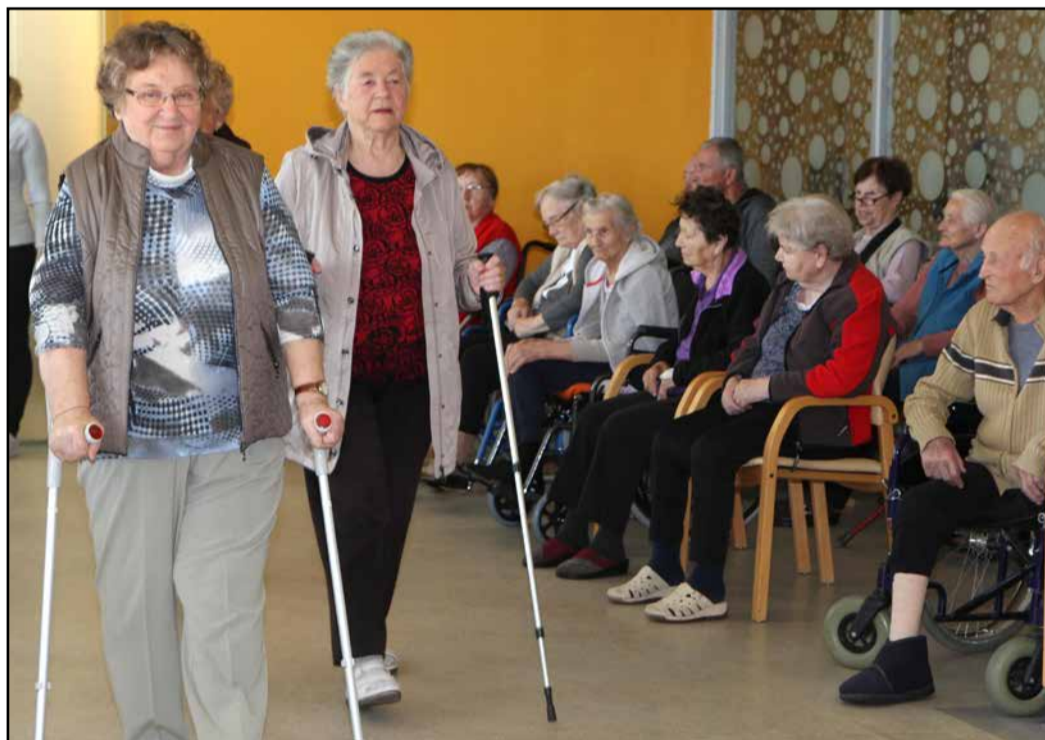
Kje piše, da se lahko po modnih brveh sprehajajo samo mladi? Polzelski manekeni so se namreč tam odlično počutili.

V Domu upokojencev Polzela so na jesenskem dnevu odprtih vrat med drugim pripravili nekoliko neobičajno