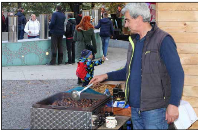
Ob pivu se je prilegel tudi pečen kostanj