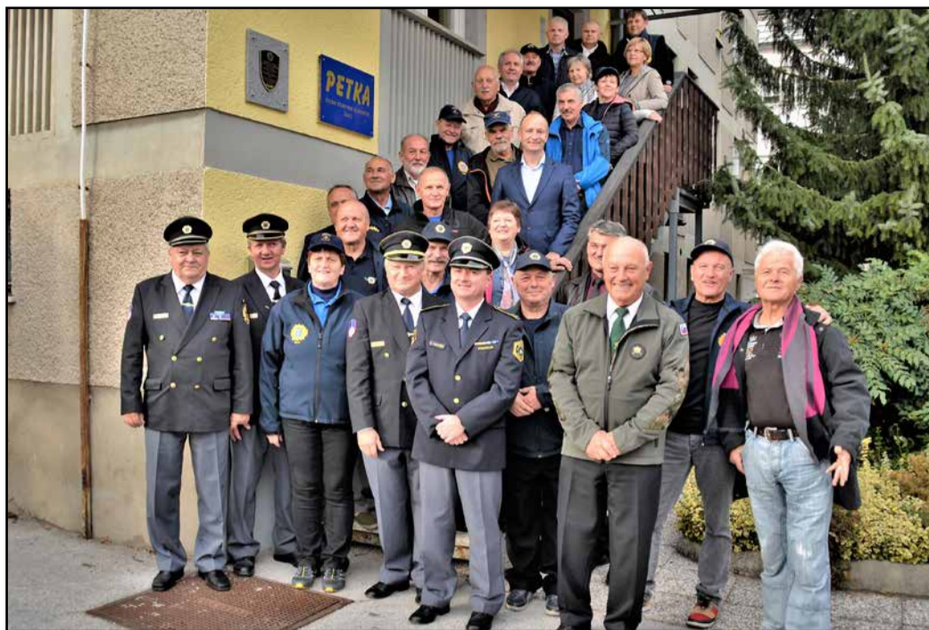
Nekdanji sodelavci z županom, s predsednikom Zveze policijskih veteranskih društev Sever in predsednikom ZVVS Spodnje Savinjske doline

V četrtek, 25. oktobra, smo v Žalcu obeležili državni praznik (ki ni dela prost dan) – dan suverenosti, in sicer v spomin na dan pred 27 leti, ko je iz Luke Koper odplula ladja z zadnjimi vojaki jugoslovanske vojske. Pred poslopjem sedanjega podjetja Petka, v katerem so bili prostori policijske postaje, so odkrili spominsko ploščo, ki spominja na čas osamosvojitvenih procesov in vojne za Slovenijo v letih 1990/91.