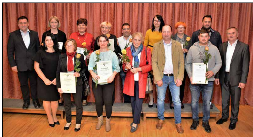
Dobitniki priznanj z županom, s podžupanom in predsednico komisije

V kulturni dvorani v Preboldu je drugi novembrski petek potekala zaključna prireditev Naš kraj lep in urejen, na kateri so podelili priznanja za najlepše urejene hiše, kmetije, poslovni prostor, gostinski lokal, kamp in športnorekreacijski prostor za leto 2018.