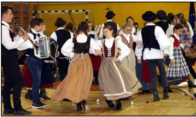
Učenci in učitelji so pripravili odličen program