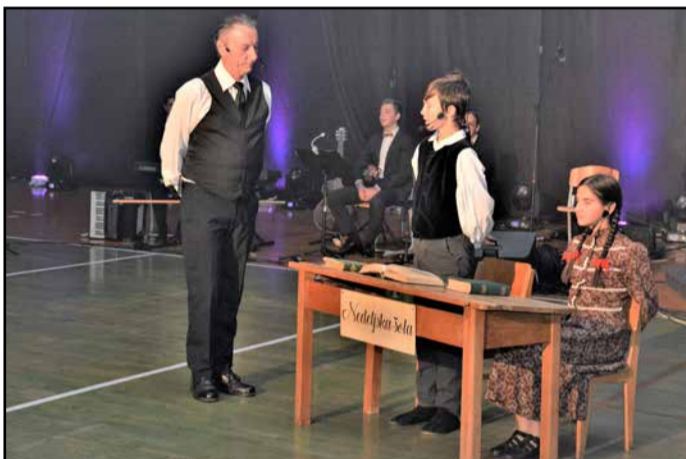
Skozi igro so obudili spomin na nekdanje šolske dni.

in šport, je ob koncu veselo pritegnilo šolski himni, ki je prežeta z mladim ustvarjalnim nemirrom, željo po znanju in upanjem na svetlo prihodnost šolstva v Šempetru.