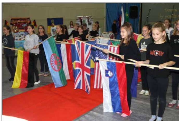
S tržnice jezikov in kultur

Na jezikovnih stojnicah so mame priseljenih učencev predstavile del kulture različnih narodnosti. Na stojnicah se je predstavilo kar devet jezikov, in sicer albanščina, angleščina, kitajščina, nemščina, nizozemščina, makedonščina, romščina, ruščina in ukrajinščina. Ti jeziki so nekaterim učencem