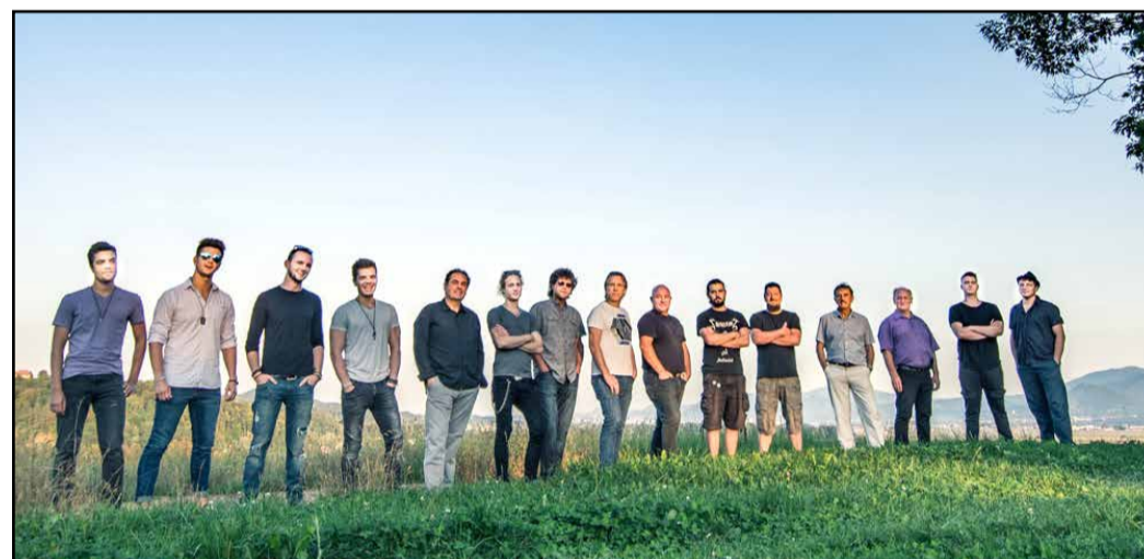
Na zgoščenki se je predstavilo veliko polzelskih glasbenikov.