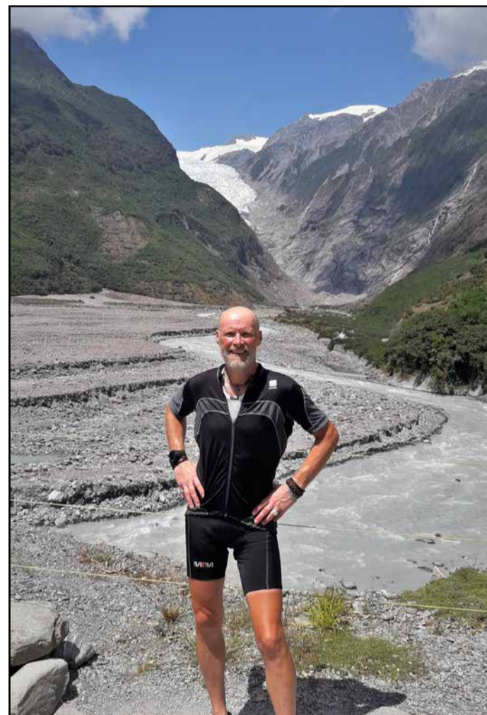
Joži ob vznožju ledenika Franz Josef

Gisborna, kar je bila pravilna odločitev. Ozka cesta in veliko območje brez signala. Potrebno je povedati, da je na Novi Zelandiji veliko območij, kjer ni nobenega signala. Največ štiri dni sem bil odrezan od sodobne tehnologije. V primeru težav je to lahko velik problem. Naslednji dnevi do Aucklanda so bili eno samo veliko uživanje. Že nekaj časa se nisem več