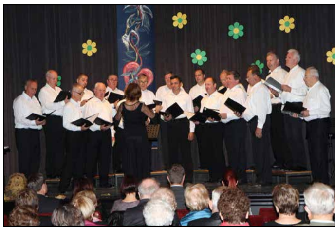
MPZ KUD Polzela med nastopom ob 65-letnici delovanja

Čeprav je 65 let dolga doba, so nekateri pevci vztrajali v zboru že od samega začetka. V mladih letih jih je privlačila pesem, ki so jo zapeli pod vaško lipo, v srednjih letih so prepevali zahtevnejši program, v