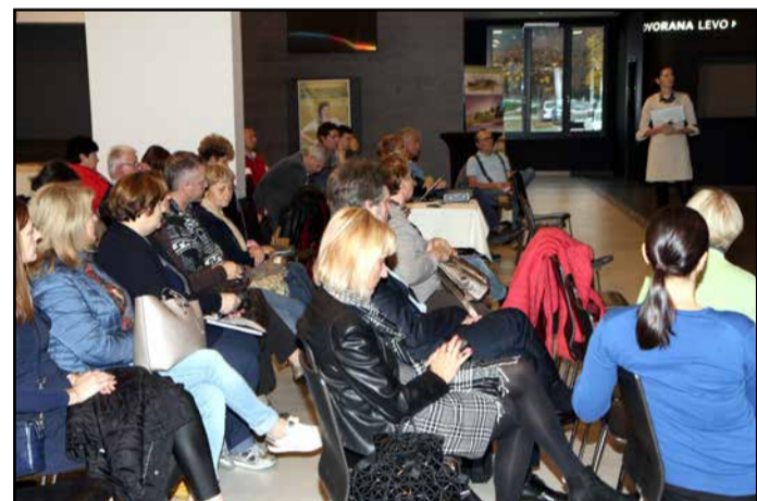
Z druge delavnice

stitorje oz. v vmesnem času pridobiti soinvesticijska sredstva iz drugih virov. Izbrani izvajalec, podjetje Projekt, se je zavezal izdelati dokumentacijo v 150 dneh, začenši s podpisom pogodbe, vrednost pogodbe pa je 44.800 evrov brez DDV. Pridobljeno gradbeno dovoljenje in zaprta finančna konstrukcija bosta osnova za pristop k izvedbi te faze predvidoma od 2019 do 2022.