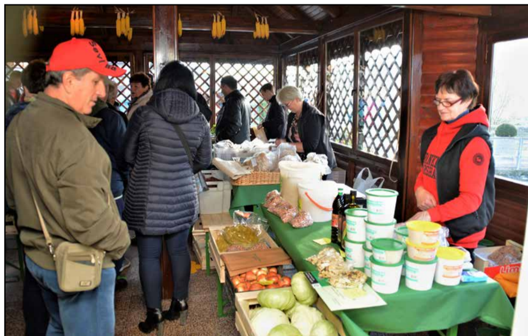
Kmečka tržnica v Preboldu od zdaj v pokritih in ogrevanih prostorih

Na kmečki tržnici v Preboldu so za prodajalce in tudi kupce precej izboljšali pogoje trgovanja. V okviru projekta Družabni center Muzejska zbirka Prebold, ki je sofinanciran s sredstvi iz Evropskega sklada za razvoj podeželja, so poleg obnove dvorišča muzejske zbirke in drugih del uredili tudi prostor za delovanje tržnice.