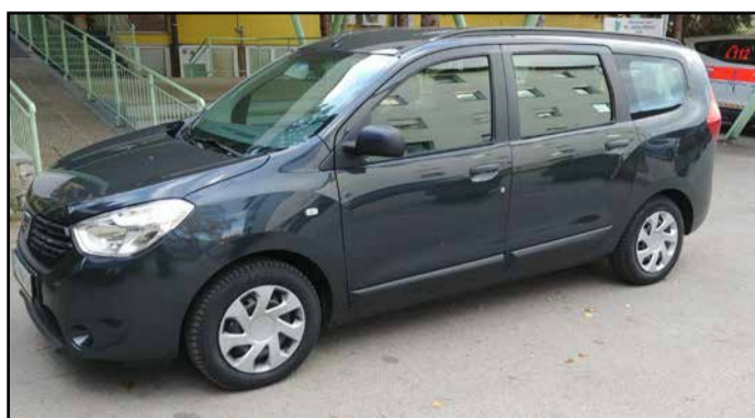
Novo vozilo ZD Žalec

V okviru projekta so že obli- kovali več strokovnih skupin, ki skrbijo za lažje in boljše usklajevanje med posamezni- mi delovnimi enotami primar- nega zdravstvenega varstva. Del projekta so tudi aktivnosti patronažnih diplomiranih me- dicinskih sester, in sicer dodati obiski otročnic in novoro- jenčkov, vzpostavljanje stikov z ljudmi, ki se ne odzovejo povabilu k sodelovanju v pre- ventivnih programih, dodatni