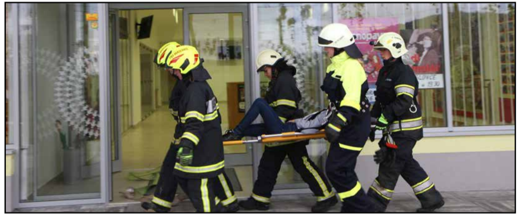
Gasilke izvedle operativno vajo

V Braslovčah je v soboto, 27. oktobra, v okviru meseca požarne varnosti potekala zanimiva gasilska vaja, ki so jo izvedle operativne gasilke savinjsko-šaleške regije.