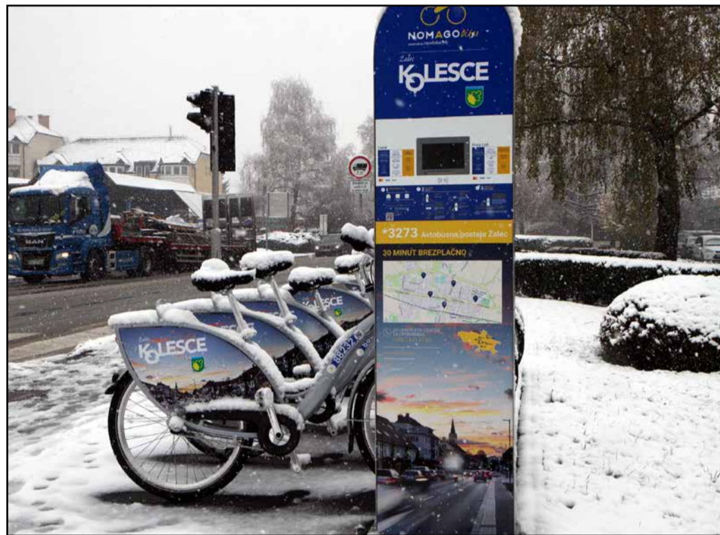
Uporabnike koles v Žalcu je pričakal moker in zasnežen sedež.