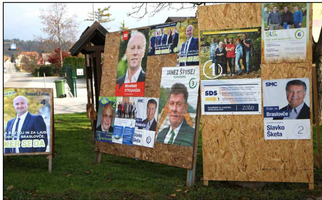
V Braslovčah so med štirimi kandidati izbrali dva, ki se bosta pomerila v drugem krogu.