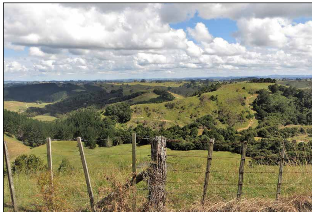
Zelena novozelandska pokrajina

obremenjeval z ničimer, kilometri, vreme, gorske ceste. Da sem začel uživati na potovanju, sem potreboval en mesec in pol. Pri jezeru Taupo sem prenočeval dva dni, prav tako tudi v Rotorui, kjer sem si ogledal maorsko vas. Najbolj sta me očarali kuhinja in kopalnica. S pomočjo toplih vrečev so kuhali in imeli toplo vodo za umivanje. Tudi kulturni pro-