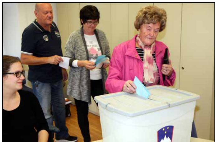
Marsikje je bila gneča že na predčasnih volitvah.