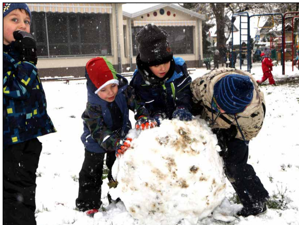
Otroci hitro najdejo razlog za veselje.