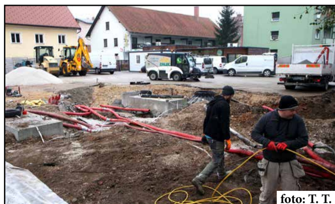
Takole razkopana je te dni tržnica v Žalcu, ki bo predvidoma do konca leta dobila novo streho, razširili pa bodo tudi njeno ploščad in uredili infrastrukturo.