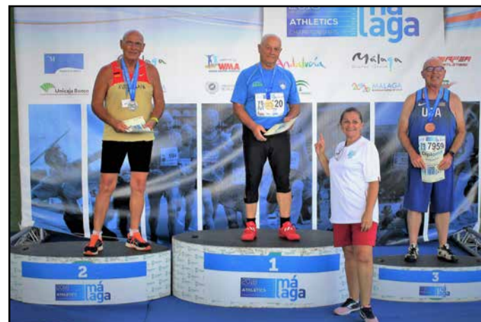
Adi je stopil tudi na atletski Olimp in postal svetovni prvak.

Prvo letošnje medaljo pa je osvojil 3. februarja na veteranskem državnem tekmovanju v Ljubljani, kjer je osvojil 1. mesto v suvanju krogle (10,70 m), sledilo je balkansko veteransko dvoransko tekmovanje, na katerem je kroglo sunil 11,26 m in zmagal. Nato je odšel na evropsko dvoransko prvenstvo, na katerem je z metom kladiva (41,21) in gire (16,17) pristal na 2. mestu, v metu krogle (11,10) pa je osvojil tretje mesto. V Ljubljani je 7. aprila potekalo državno veteransko prvenstvo v dolgih metih. Veselil se je prvega mesta v metu diska (32,54), kladiva (40,73) in gire (16,27). V Domžalah je konec maja z osvojenimi 4048 točkami osvojil naslov državnega prvaka v metalskem peterboju. Na državnem veteranskem