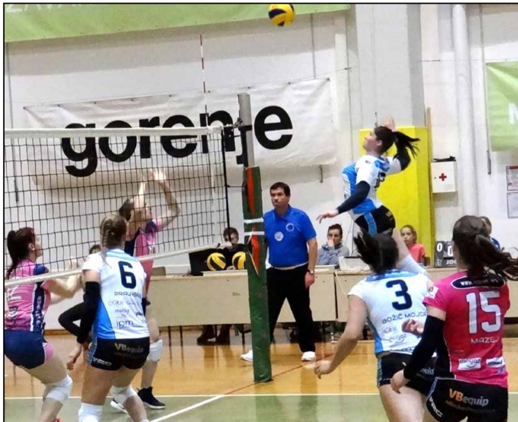
Odbojkarice SIP Šempetra so slavile zmago nad ŽOK Ljutomer.