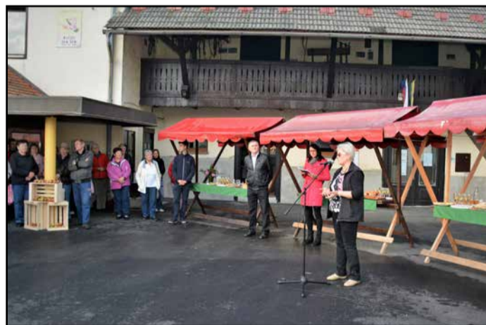
Dvorišče Muzejske zbirke Prebold skozi čas so na novo asfaltirali in uredili.