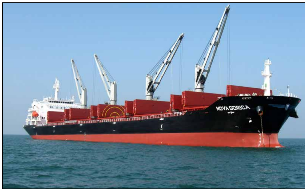
»Urškina« ladja Nova Gorica

V povprečju posadka na tovornih tovornih ladjah šteje od 19 do 20 ljudi. Če so na kopnem za eno službo ali dejavnost odgovorne dve ali tri ali celo še več oseb, je na ladji to ravno obratno. Ena oseba ima vsaj pet zadolžitve. Število teh