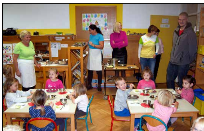
Slovenski zajtrk z gosti

Največ medu so za VVZ Žalec, ki ima v svojih enotah 950 otrok, prispevali člani čebelar-