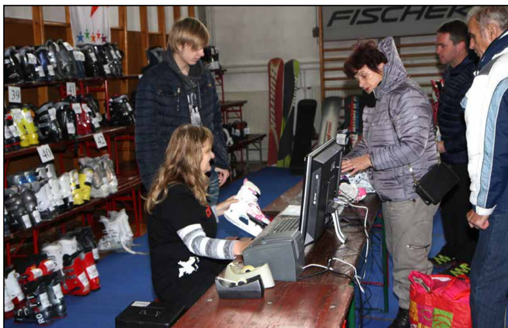
S sejma rabljene smučarske opreme v telovadnici UPI – ljudske univerze Žalec

Smučarski klub Gozdnik Žalec je predzadnji novembrski vikend v telovadnici UPI – ljudske univerze Žalec pripravil sejem rabljene smučarske in druge športne opreme.