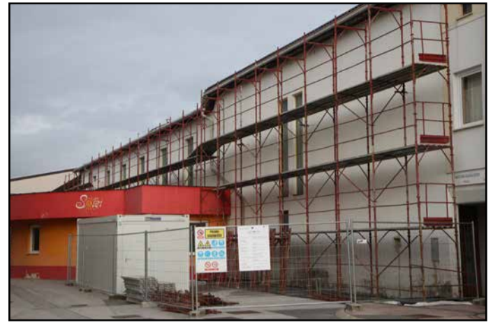
Z energetske sanacije dvorane na Polzeli so že začeli.

Energetska sanacija športne dvorane bo obsegala sanacijo zunanjih sten in strehe, zamenjavo dotrajanega stavbnega pohištva, vgradnjo prezračevalne in rekuperacijske, energetskega monitoringa in posodobitev regulacije ogrevanja.