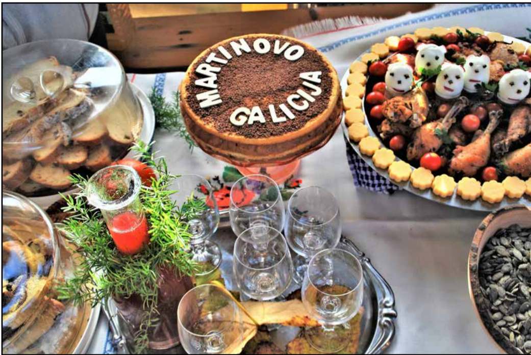
Na prireditvi ni manjkalo raznih dobrot, ki so se prilegle mlademu vinu.

Turistično društvo Galicija že nekaj let pripravlja pod farovskim kozolcem tudi vaško martinovanje. Je nekaj posebnega, saj njihovi zaselki in društva napolnijo svoje stojnice z vsemogočimi dobrotami in z njimi brezplačno razvajajo obiskovalce prireditve.