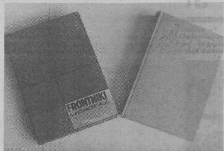
Nagrajeni deli