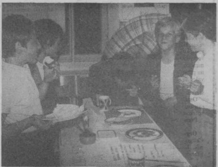
Hm, je dobro! Gospodinski krožek OŠ Edvarda Kardelja se je predstavil na šolski prireditvi s koristnim in prijetnim

Po kulturnem programu so bila zaslužnim krajanom za njih uspešno delo podeljena priznanja krajevne skupnosti, aktivnim družbenopolitičnim delavcem pa za njihovo dolgoletno delovanje priznanja Osvobodilne fronte.