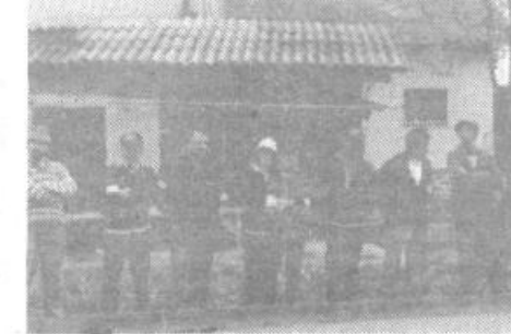
Navijač. z zanimanjem spremljajo prvo ligaško srečanje prve ekipe Horjula.

V prvi polovici maja so se začela tekmovalja v SBL – zahod in sever, Horjul v prvih dveh krogih ni imel uspeha, saj je izgubil proti 8. septembru iz Štanjela in Erasmu iz Postojne, nadaljevanje pa je prineslo veliko več, kot bi lahko pričakovali – gladki zmagi nad Anteno iz Portoroža in Plamo iz Podgrada ter v zadnjem kolu spomladanskega dela tesno zmago nad Hermesom iz Ljubljane. Tako je zdaj Horjul uvrščen na 5. mesto lestvice SBL – zahod, pri čemer zaostaja 2 točki za vodčim Jadranom in točko za 8. septembrom, medtem ko imata 3. Hrast in 4. Erazem enako število točk. Vsekakor lep uspeh za tekmovalce brez izkušenj s podobnih tekmovalj.