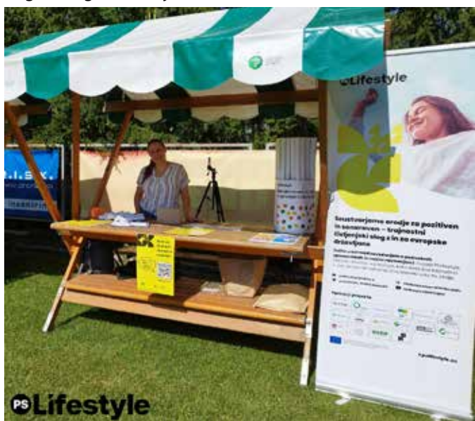
Na sončen jesenski dan smo na srečanju Četrtna skupnosti Šentvid predstavili inovativno spletno aplikacijo PSL ter spremljajoči EU projekt PSLifestyle

Na jesenskem srečanju Četrtna skupnosti Šentvid, ki je potekalo v soboto, 9. septembra 2023, smo predstavili inovativno spletno aplikacijo PSL ter spremljajoči EU projekt PSLifestyle. S pomočjo spletne aplikacije PSL lahko meščani izračunate svoj ogljični odtis na podlagi svojih navad in potrošniškega vedenja. Ogljični odtis predstavlja vsoto emisij toplogrednih plinov, ki jih ustvarimo s svojimi vsakodnevnimi dejavnostmi, kot so vožnja z avtomobilom, poraba električne energije, potrošnja hrane in nakupovanje izdelkov. Izračun ogljičnega odtisa nam pomaga razumeti, koliko onesnaženja prispevamo posamezniki ali skupnost. Na ta način lažje načrtujemo ukrepe za zmanjšanje emisij, hkrati pa tudi vpliv negativnega na okolje.