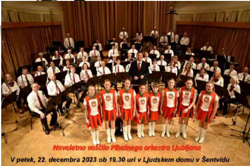
Novoletno voščilo Pihalnega orkestra Ljubljana

Zahvaljujemo se Četrtni skupnosti Šentvid, ker omogoča tako igriva in čarobna decembrska praznovanja!