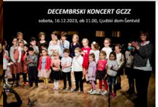
DECEMBRSKI KONCERT GCZZ

V petek, 22. decembra 2023 ob 19.30 uri v Ljudskem domu v Šentvidu