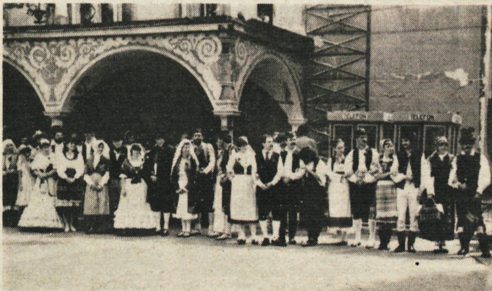
Poročni pari na slovesnem sprejemu v Kamniku