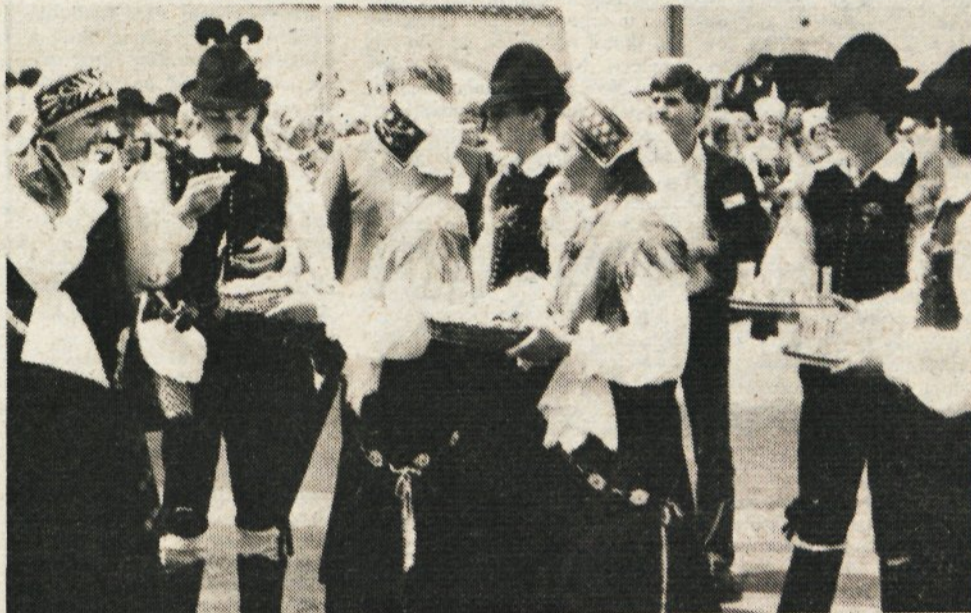
Pogostitev s kruhom, soljo in žganjem (na levi slovenski par)