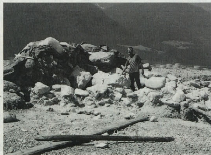
Grobnica še ni odprta, a znaki ropa so že vidni