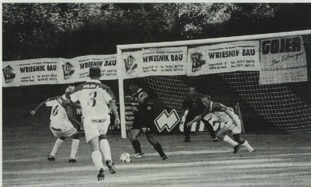
Obramba SAK je imela v prvem polčasu veliko dela

Rezultati: Trg – Welzenegg 4 : 0, Friesach – St. Michael/L. 0 : 2, Magdalen – Treibach 1 : 0, Maria Gail – Wietersdorf 3 : 1, Nußdorf – Landskron 2 : 0, St. Andrä – SAK 2 : 4, ATUS Borovlje – Lendorf 0 : 1 2. krog (11./12. 8.): St. Michael/L. – Nußdorf, Treibach – Maria Gail, SAK – Trg, Lendorf – Wietersdorf, Landskron – St. Andrä, ATUS Borovlje – Friesach, Welzenegg – Magdalen