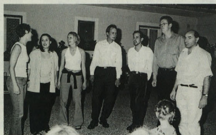
Skupina Nomos iz Škocjana