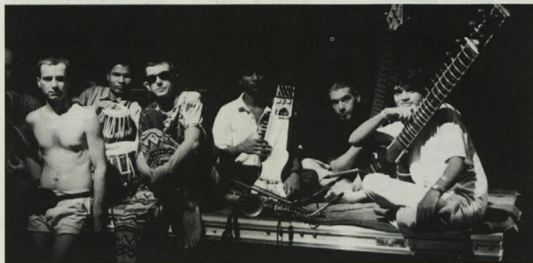
Člani ansambla indoevropske glasbe

Posebnost in hkrati novost letošnje poletne festivalske Ljubljane je Emonska promenada, s katero se bosta v času od 27. avgusta do 2. septembra na simboličen način povezala program-