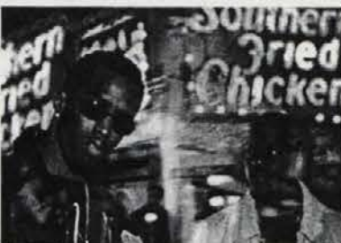
Puff Daddy & The family - No way out

V zadnjih mesecih se je svet rapa dvakrat odel v črmino. 2 PAC in NOTORIOUS B.I.G. sta bila po besedah policijskih izvedencev žrtvi neznancev, vendar o uboju dveh mladih, eminentnih predstavnikov t.i. GANGSTA RAPA krožijo različne razlage, domneve in špekulacije. Hiter prestop iz getov v svet show buisnesa je bil usoden za izvajalca dveh velikih, med seboj antagonističnih in osvražanih založb iz vzhodne in zahodne obale ZDA, BAD BOY Entertainment in njenega podjetnega lastnika PUFF DADDY ja ter rasistično usmerjene DEATH ROW Records SUGEja KNIGHTa. Kje se končajo igre z denarjem, meje nasilnosti in zaničevanje šibkejših ter drugačnih? WYCLEF JEAN , duhovni vodja projekta THE FUGEES in WU TANG CLAN ponujajo drugačno realnost. Z zaskrbljenostjo se uzirajo k s sovraštvom na ustih in z zlatom okovanim črnim bratom. SEAN "PUFF" DADDY , lastnik založbe BAD BOY in tesen prijatelj BIGGIIA , je s svojim prvim glasbenim projektom NO WAY OUT prepozno zakopal okrvavljeno bojno sekuro. Strele iz uzijev so zamenjali spomini, bolečina in upanje zazrto v prihodnost in pomoč sočloveku. PUFF , ki je odrasčal v MONT VERNONU , v zvezni državi NEW YORK , je med navdušenostjo nad dedki in očeti rapa ( GRANDMASTER FLASH , RUN DMC ...) sanjal o svoji pevski karijeri.