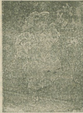
Elsley: Guten Morgen

Laibach, Prešerengasse , gegenüber der Hauptpost. (3531) 54