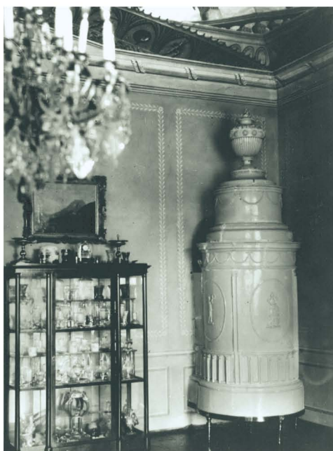
Biedermajerska vitrina v nekdanjem salonu 1933. leta (slika levo) in ista vitrina (desno), danes v zasebni lasti.

zbirko o zgodovini mesta posodila intarzirano mizico za igro backgammon (igra je znana pod nemškim imenom trik-trak), dva empirska lestenca iz ok. 1810. leta, tri baročne slike z žanrskimi in alegoričnimi prizori, ledinsko karto mesta Ormož iz 1801. leta in portalno uro. 44 V letih 1954, 1964 in 1966 je nekatere kose pohištva odkupil ptujski muzej, in sicer dve klasicistični skrinji ter precej kosov neoklasicističnega pohištva iz druge polovice 19. stoletja. Pohištvo je podrobneje predstavljeno v katalogu Razkošje na podeželju, Pohištvo v ptujskem gradu. 45