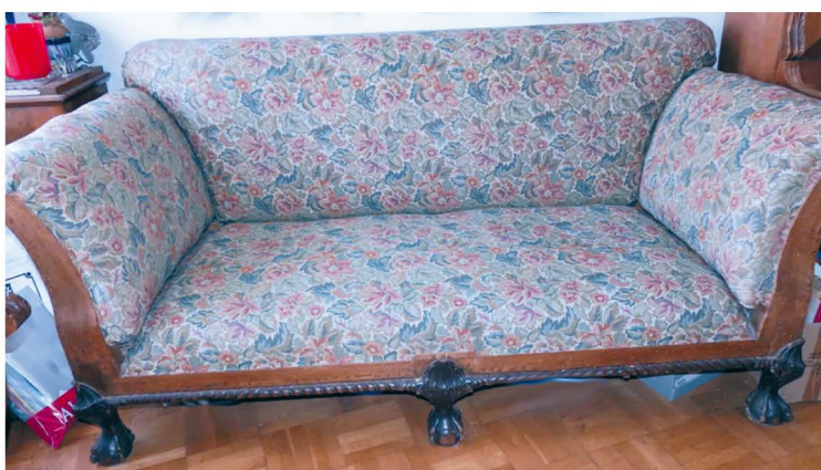
[Pobištvo iz ormoškega gradu, danes v zasebni lasti.

Čeprav M. Ciglencečki navaja v svojem članku, da se je grofica Irma izselila komaj 1947. 47 leta, pa piše M. Hernja Masten, da je bila grofica lastnica gradu do leta 1945. Tega leta je grad prevzela v upravljanje Uprava državnih posestev Ormož, v njem so stanovale stranke in uslužbenci. Leta 1946 je bil grad s parkom zaščiten in proglašen za kulturni spomenik. 11. marca 1951 se je v grad vselil garnizon JLA, ki je ostal v gradu do 6. julija 1956. 48 Ko je grad izpraznila vojaška enota, je bil sklican sestanek komisije za prevzem ormoškega gradu. Ta je ugotovila, da večja škoda ni nastala oz. da gre večinoma za redno obrabo in nevzdrževanje. Po izpraznitvi je bil grad namenjen