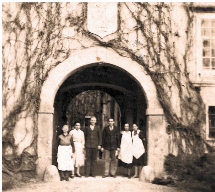
Grajski služabniki pred glavnim grajskim vhomom. Fotografija ni datirana.

V parku za pristavo pa je bil ribnik, po katerem so se v čolnu vozile kontese.«