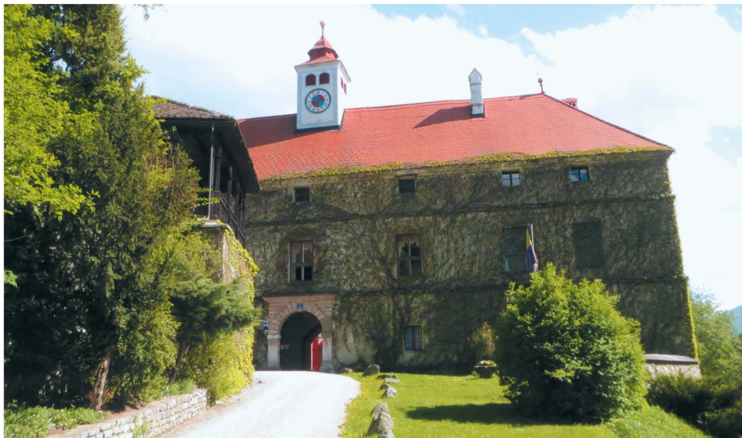
| Grad Pernegg.