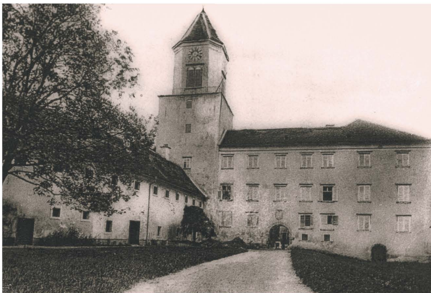
Ormoški grad okrog 1950. leta; gospodarski trakt prislonjen na stolp so porušili v 60-ih letih.