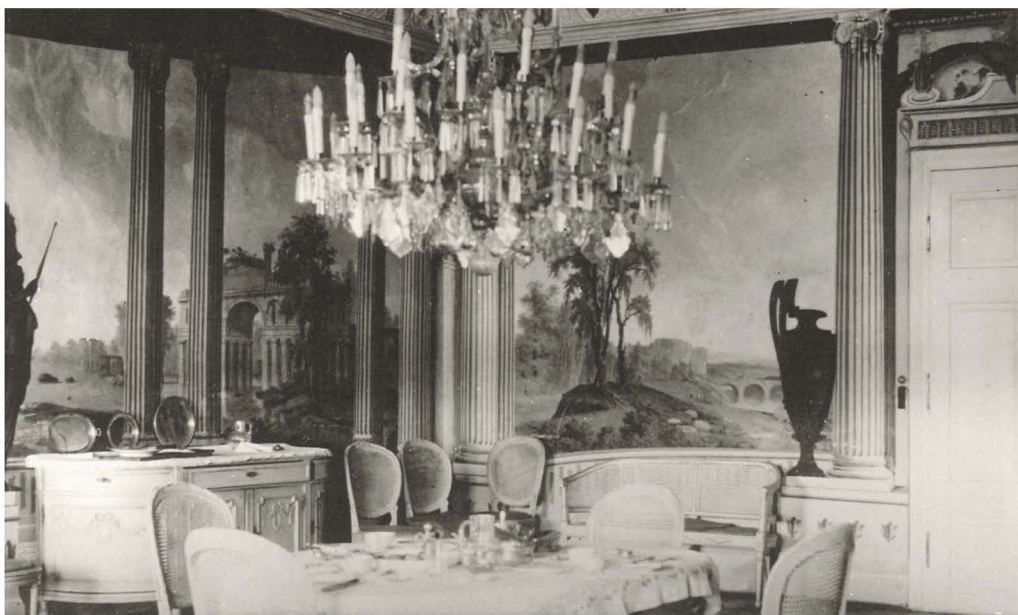
Pogled na nekdanjo jedilniško garnituro ormoškega gradu 1933. leta, ki jo je leta 1954 odkupil ptujski muzej.

zbirko o zgodovini mesta posodila intarzirano mizico za igro backgammon (igra je znana pod nemškim imenom trik-trak), dva empirska lestenca iz ok. 1810. leta, tri baročne slike z žanrskimi in alegoričnimi prizori, ledinsko karto mesta Ormož iz 1801. leta in portalno uro. 44 V letih 1954, 1964 in 1966 je nekatere kose pohištva odkupil ptujski muzej, in sicer dve klasicistični skrinji ter precej kosov neoklasicističnega pohištva iz druge polovice 19. stoletja. Pohištvo je podrobneje predstavljeno v katalogu Razkošje na podeželju, Pohištvo v ptujskem gradu. 45