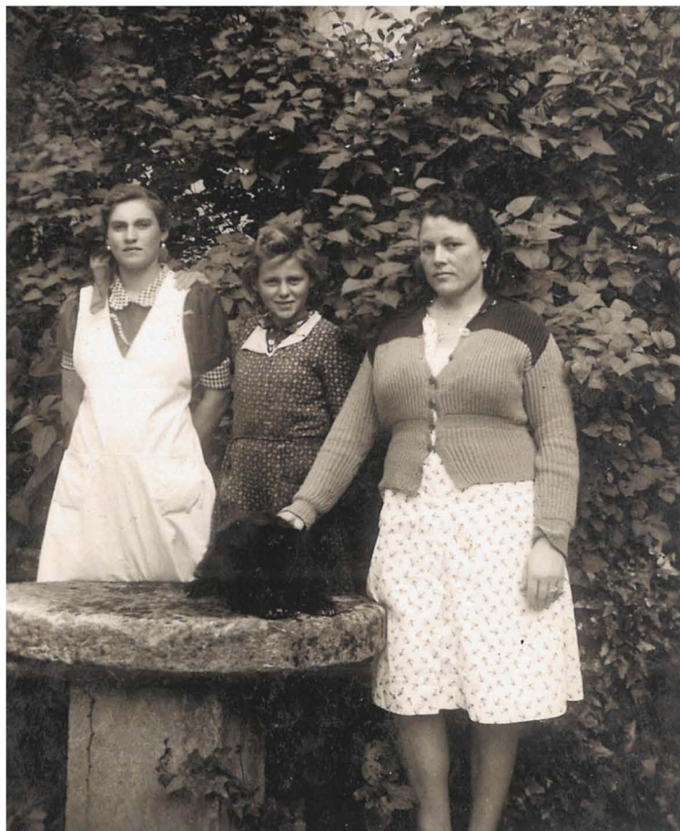
Sobarice v gradu. Fotografija ni datirana.