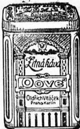
Oldřich Vítáček, Praga-Karlín št. 204. odd. 18.

samo z našo žitno kavo. Zaračunamo v platnenih vrečkah po 5 kg K 4.—. Da se pa prav posebno ohrani, jo pošljemo pri prvem naročilu v lepo okrašeni pločevinasti škatli (imitacija starega srebra) kakor na poleg stoječi sliki v skupni teži 5 kg za K 4.50. Poštnino plačamo sami. V teh škatljah ohrani kava cele mesece svoj izborni okus.