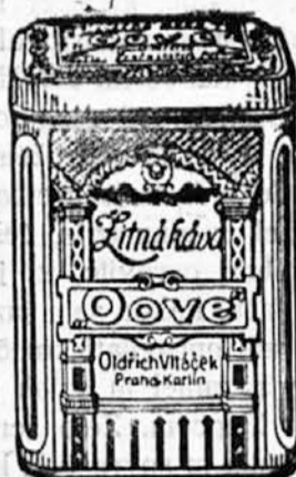
Oldřich Vitaček, Praga-Karlín št. 204. odd. 18.

samo z našo žitno kavo. Zaračunamo v platnenih vrečkah po 5 kg K 4.—. Da se pa prav posebno ohrani, jo pošljemo pri prvem naročilu v lepo okrašeni pločevinasti škatli (imitacija starega srebra kakor na poleg stoječi sliki) v skupni teži 5 kg za K 4.50. Poštnino plačamo sami. V teh škatljah ohrani kava cele mesece svoj izborni okus.