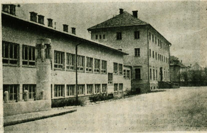
BODOČI SAMSKI DOM V KAMNIKU

Cedalje večje potrebe po zdravstvenih storitvah terjajo, da še letos kamniški zdravstveni dom dobi nove prostore. Po sedanjem predlogu bi v ta namen letos dogradili prvi trakt doma SZDL, v drugem traktu pa bi dobili svoje prostore knjižnica, delavska univerza, glasbena šola in telovadnica. Res je že zadnji čas, da zgradba začne služiti svojemu namenu.