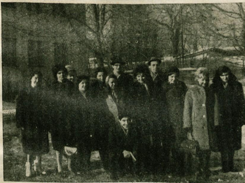
Knjižničarski tečaj v Kamniku

V zadnjih dneh meseca januarja je Ljudska knjižnica Kamnik ob pomoči Zveze prosvetnih društev Svobod občine Kamnik priredila dvodnevni knjižničarski tečaj. Udeležilo se ga je 12 knjižničarjev šolskih, ljudskih in tovarniških strokovnih knjižnic.