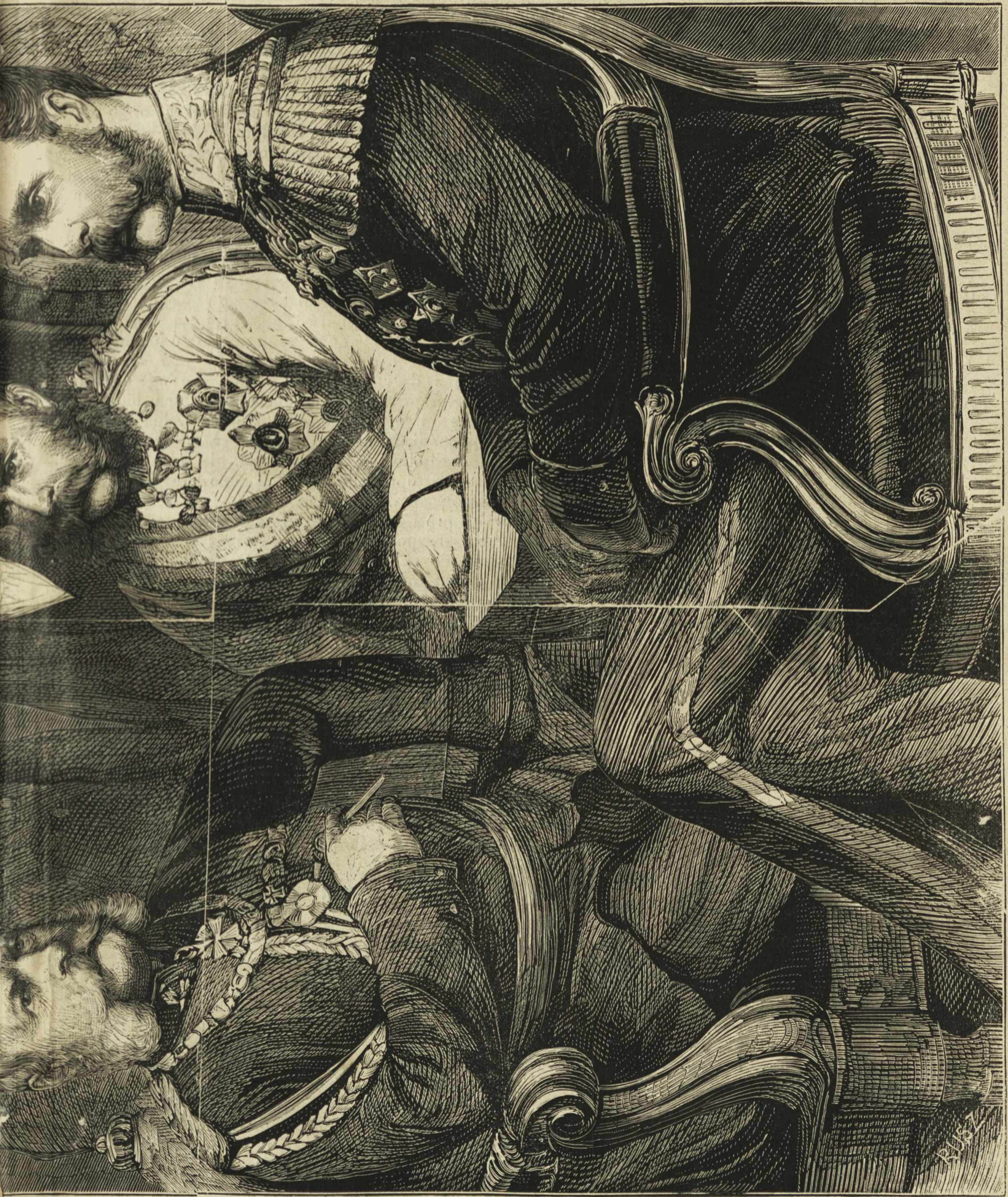
Trjé caszarje i nyihovi ministri.