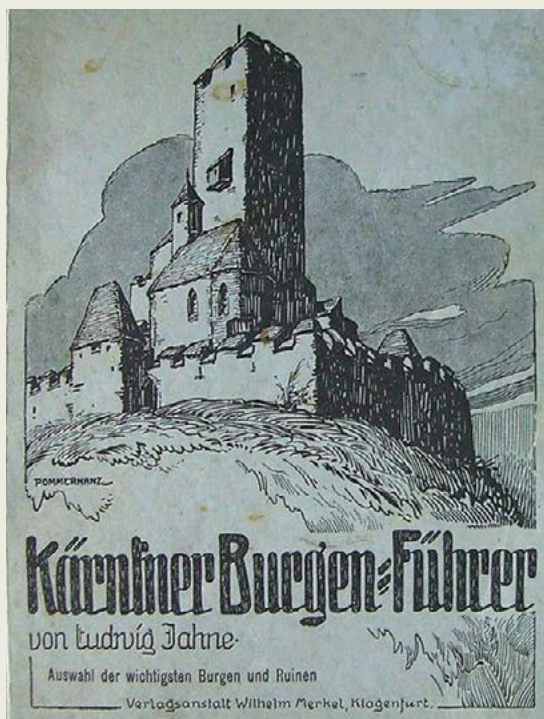
Vir svetovni splet