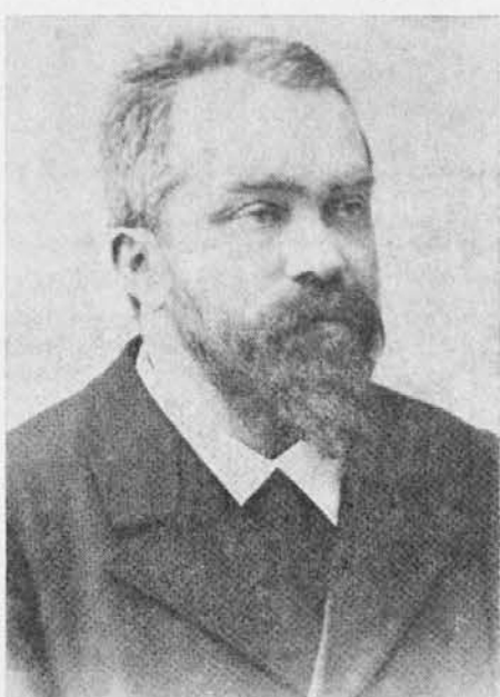
Pesnik Anton Aškerc v letih svojega bivanja v Ljubljani