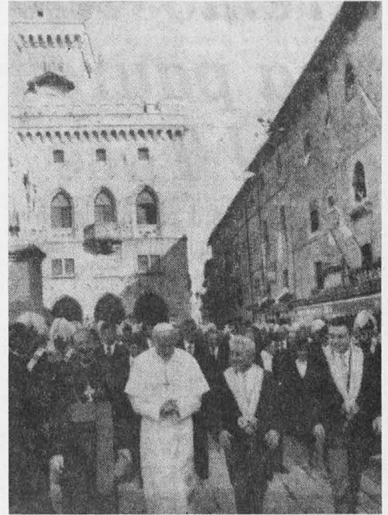
Sv. oče odhaja iz parlamenta v San Marinu

Po sv. maši je sv. oče stopil v avtomobil ter se dal peljati po plaži in mestnih ulicah. Tudi ta vožnja je pokazala, kako njegova navzočnost vsakogar, ki ga vidi, osrečuje. Lahko rečemo, da je tudi za Rimini papežev obisk postal nepozaben dan, »dan, ki ga je naredil Gospod«.