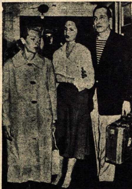
Pred kratkim smo pisali o bedni usodi bogatih otrok filmskih zvezd. Tudi ta dogodek kaže, kako je s temi milijonarskim optički brez gnezde.