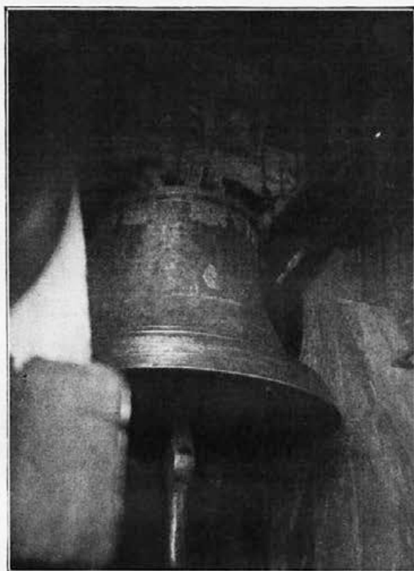
Sl. 3. Zvon poldnevnik (v stolpu župne cerkve v Prostějovu).

IOSEPHUS 14 REX UNGARIAE CORONATUS IN REGE(M) ROMANORV(M) AVGUSTAE DIE · 26 · IAN. 1690