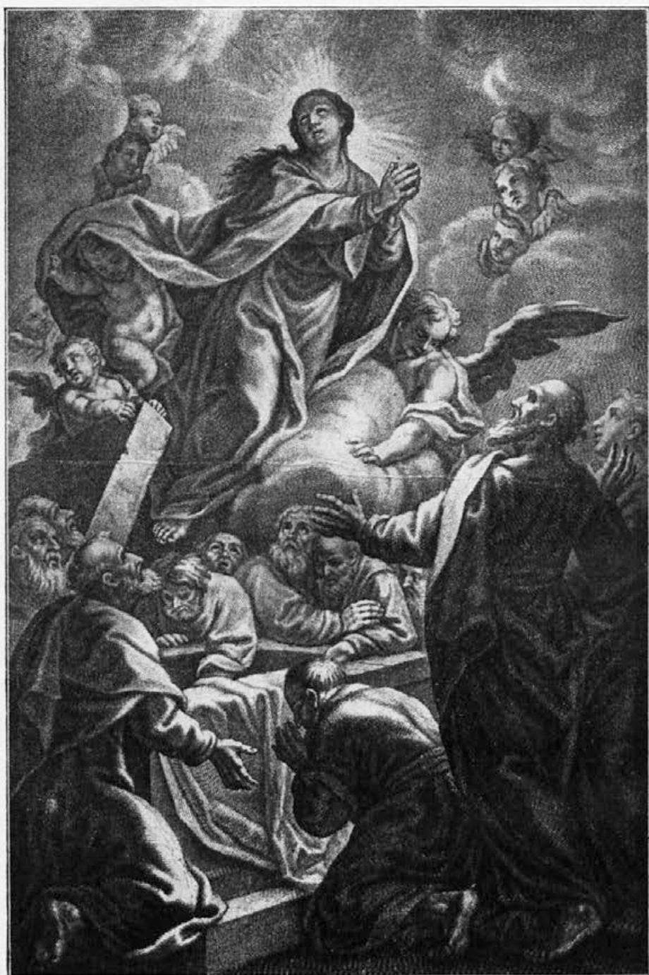
Sl. 5. Valentin Metzinger: Marijino vnebovzetje (bakrorez).