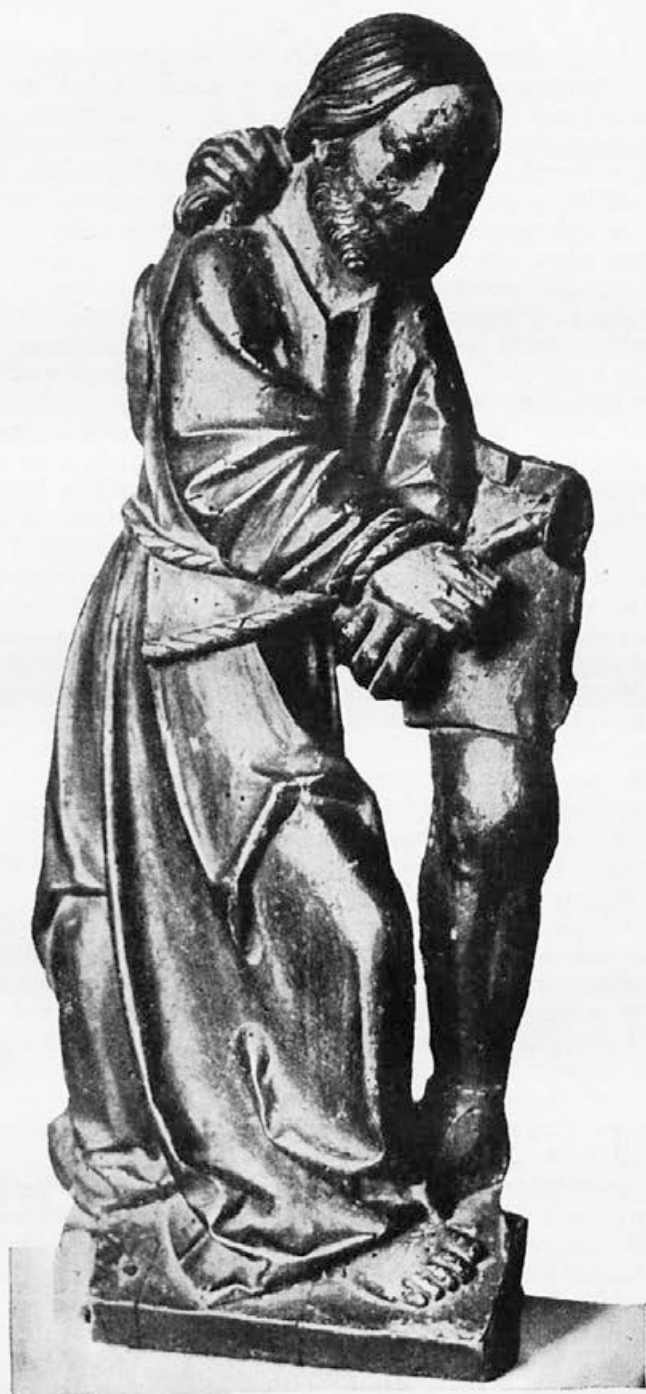
Sl. 2. Fragment gotskega pasionskega oltarja.