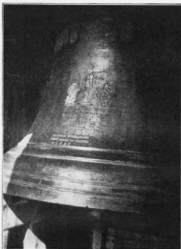
Sl. 4. Zvon sv. Križa (v zvoniku župne cerkve v Prostějovu).