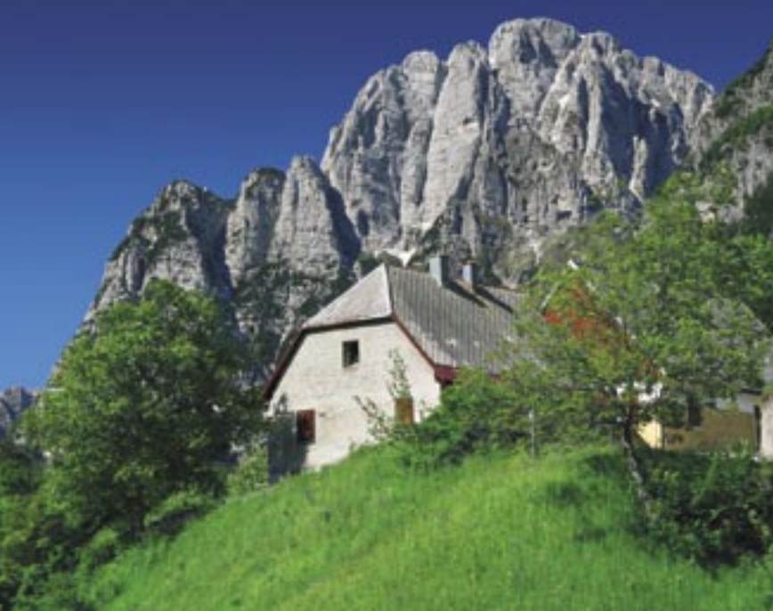
Jerebica iz vasi Strmec