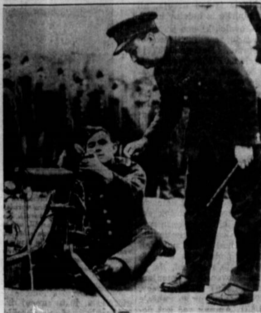
Na sliki na desni je Kermit Roosevelt, sin bivšega predsednika Zed. njanih držav, Theodora Roosevelta, ki služi kot častnik v angleški armadi. Poročajo, da je njegov namen postati angleški državljan. Dodeljen je oddelku za strojnico.