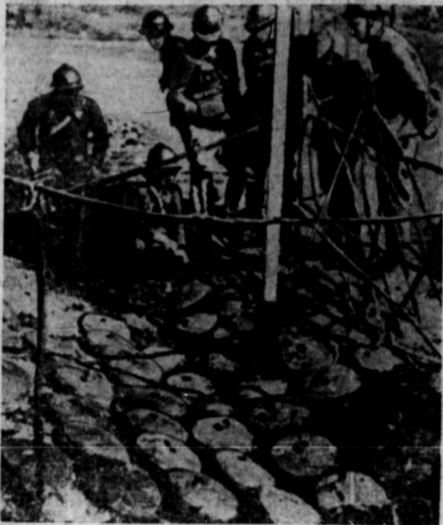
Nemški firer je pred nekaj tedni pretel, da če Anglija in Francija ne četa miru, ju bo presenetil z novimi vojnimi sredstvi, da jima bo kar žal, ko bosta ginevali pod nemško pestjo. Eno teh novih sredstev so "magnetične" mine, ki povzročajo Angliji na morju čedalje več preglavice. Vrh tega imajo Nemci izpopolnjene mine, ki jih polagajo na pot sovražniku po suhem. Francozi so imeli z njimi posebno prve tedne vojne na zapadni fronti precej opravka. Nekaj so jih francoski vojaki pobrali in snopili skupaj in ogradili, kakor predstavlja gornja slika.