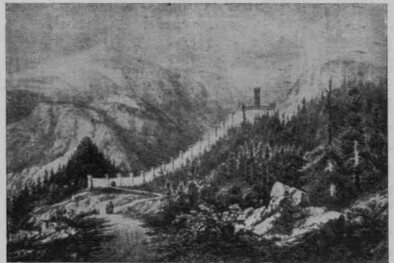
Kandlerjeva idealno umišljena rekonstrukcija rimske poštno postaje in kastela z imenom Ad pirum , danes Sv. Jedert na Hrušici. Podoba je bila prvič objavljena v delu D. V. Scussa, Storia cronografica di Trieste (Trieste 1863) ter ponatisnjena v studiji P. Sticcojija, Il limes delle Alpi Giulie (Roma 1937), Tab. I 2