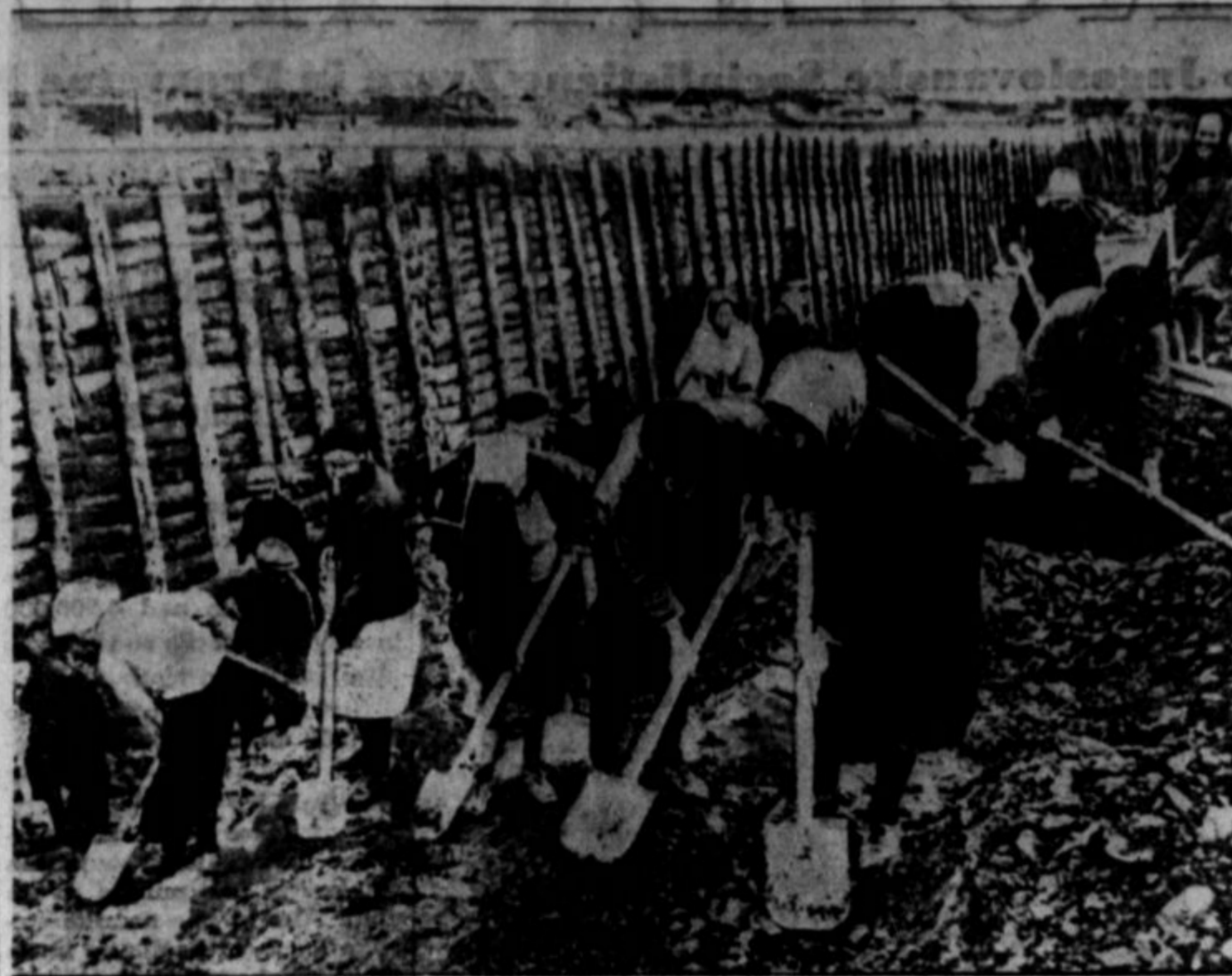
Pri obrambi Leningrada kakor pri obrambi drugih ruskih mest pomagajo tudi ženske. Gornja slika jih predstavlja v okolici Leningrada, ko kopijejo trench in grade barikade proti tankom.