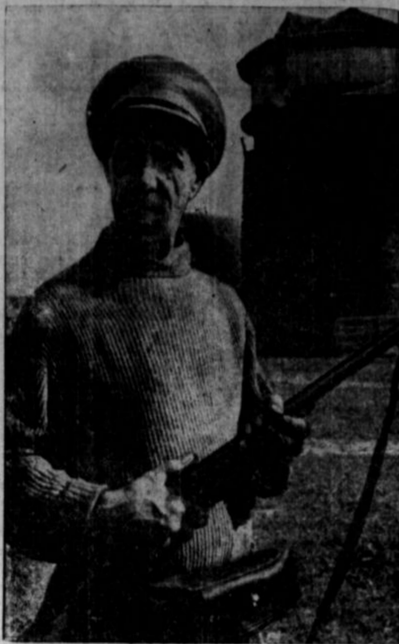
Na gornji sliki je najslavnejši ruski skladatelj in poet Dimitri Hostakovič. Prideljen je vojaški požarni brambni.

pa se boje. Policija je napravila med revnimi racijo. To je racija radi strahu. Policija vsak teden na stotine revnih zgrabi in jih pošlje v rojstne kraje. Med njimi so ljudje, ki so že trideset in štirideset let preživel v Rimu, ki jim je potres 1. 1915 uničil vasi in ki nimajo več družine; policija jih je zgrabila in jih 'radi javne varnosti' poslala domov. Tako se je prigodilo tudi Peppinu Gorianu: zgrabili so ga, mu dali uradne listine, ga posadili v vlak in ga prislili, da se je odpravil v Fontamara, ki je iz nje pred 35. leti odšel... In tako se je vrnil!"