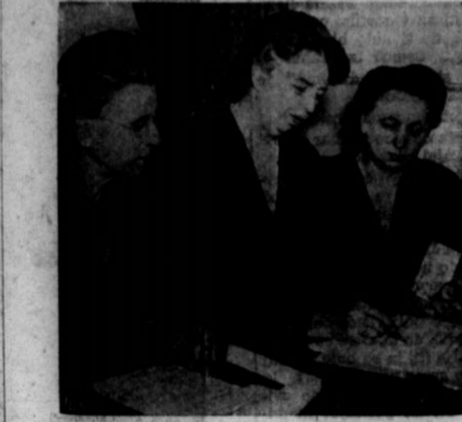
Predsednikova žena Eleanor Roosevelt organizira poseben odbor, ki bo urgiral gospodinjke, da naj kupujejo samo toliko kolikor potrebujejo...