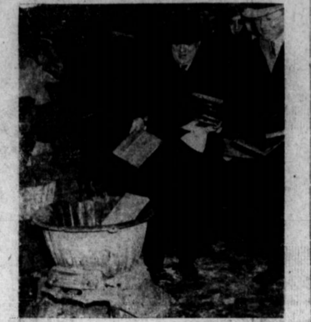
Fiorello LaGuardia slovi za najboljevoitejšega župana, kar jih imajo velika ameriška mesta. Pri zadnjih volitvah je pokazal, da mu bo težko izpodbiti tla. Gornja slika je iz časa, ko je pričel v New Yorku boj proti razpečevalcem pornografske literature in slik. (Članek o volitvah v New Yorku in drugod je na tej strani na levi.)