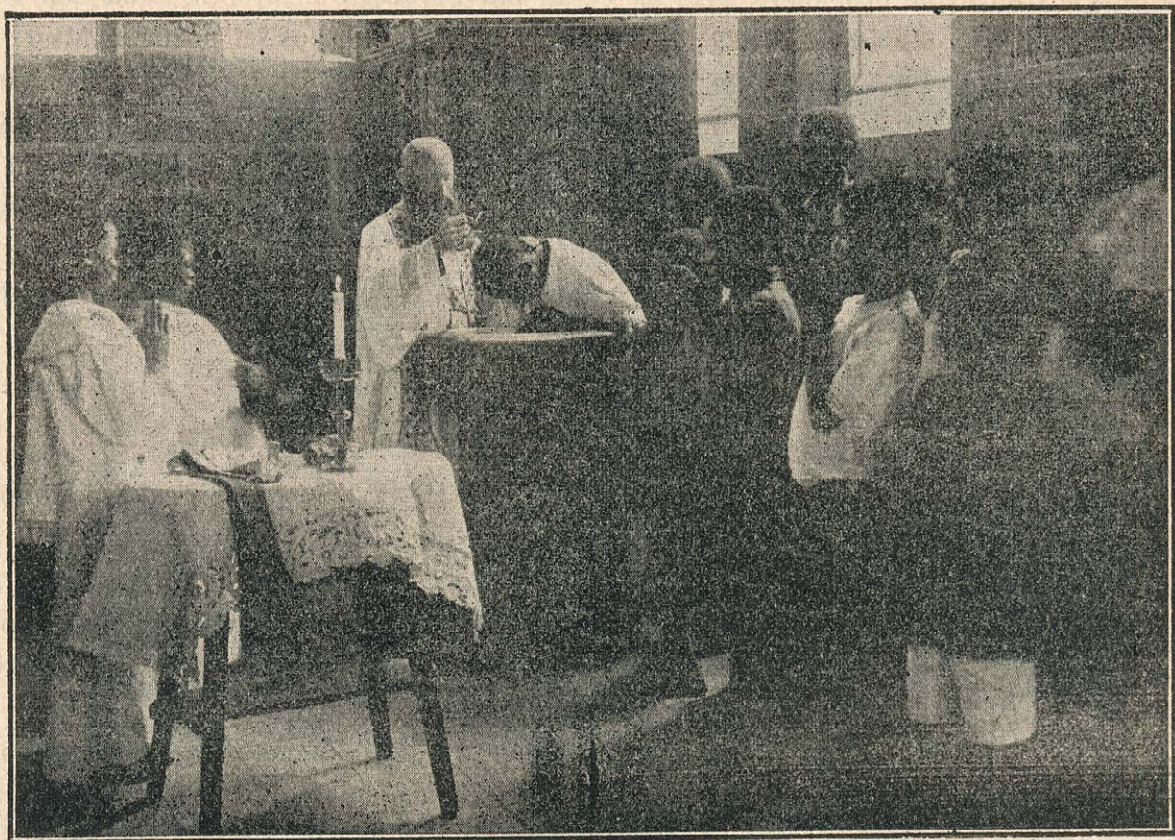
Belg. Kongo: Sv. krst.

se ni upal v notranjost. Najrazličnejša mnenja so bila glede števila Indijancev. Sami so trdili, da jih je toliko, da bi lahko strahovali vso Argentinsko državo. V resnici pa jih ni moglo biti več kot kakih 80.000. Ti Indijanci so se trdovratno upirali vsakemu poizkusu civilizacije, o krščanstvu niso hoteli nič slišati, ker so se bali, da bi s sprejetjem krščanstva izgubili svojo neodvisnost. V prejšnjih letih so misijonarji jezuitje iz Čile prekoračili Andsko gorovje ter