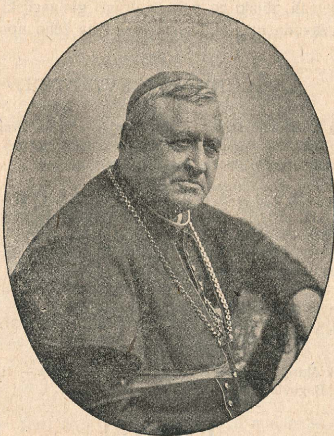
† Kardinal Janez Cagliero.

UREDNIŠTVO IN UPRAVNIŠTVO NA RAKOVNIKU V LJUBLJANI. ○ ○ ○ ○ ○ ○ ○