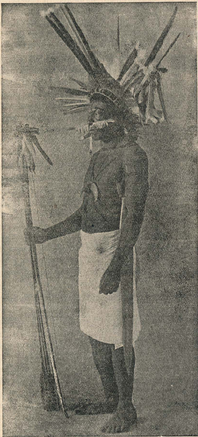
Bororski kačik v gala-opremi.

Ker se mu je prvi poizkus tako posrečil,