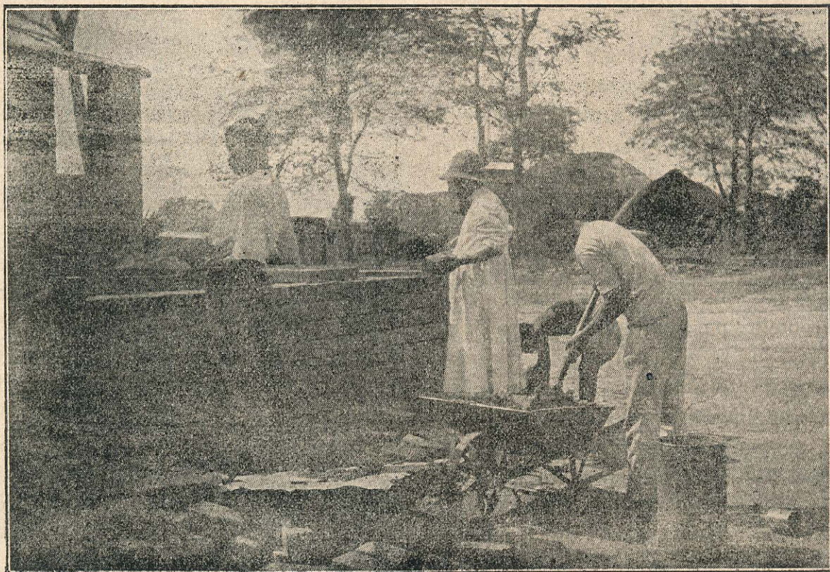
Belg. Kongo: Misijonar uči zamorce zidati hiše.

slovesnega sv. krsta. Imeli so priložnost prvokrat prisostvovati takim obredom. Mnogi so mislili, da se pri sv. krstu gode bogve kako grozne reči. Po slovesni otvoritvi misijona se jih je mnogo vpisalo med katehume. Škoda, da sem kmalu po posvetitvi moral v Macau, kjer so me čakala važna opravila in nisem mogel gojiti to vnemo. Vse sem izročil vodstvu mojega kateheta,