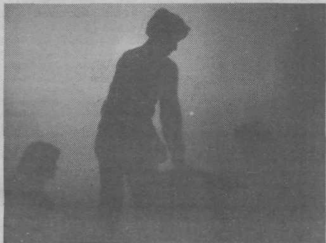
Prizor s predstave