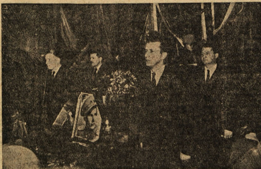
Na mrtvaškem odru v Toplicah

Ko se na tem mestu poslednjikrat poslavljam od Tebe v imenu Tvo-