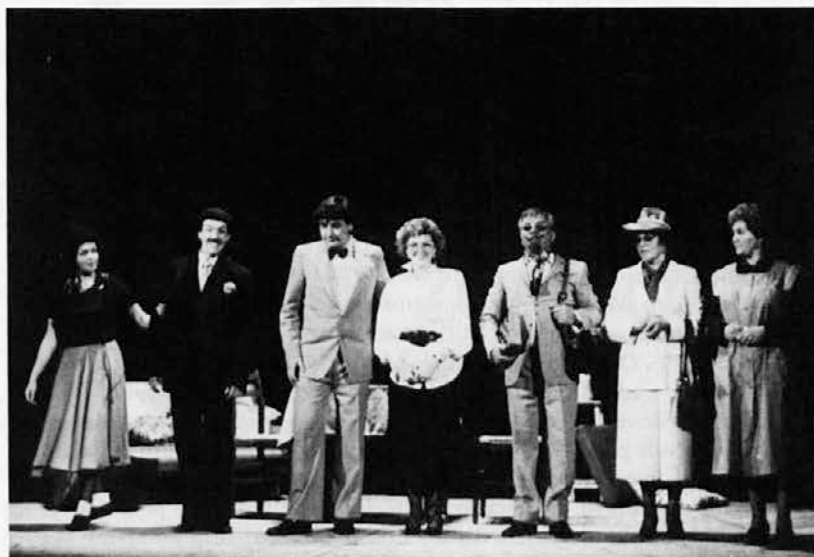
Dramska skupina SKD »Slavec« iz Ricmanj leta 1987

Ko je izbruhnila druga vojna, je Pevsko in bralno društvo »Slavec« moralo spet prekiniti svoje delovanje, a že oktobra 1945 so se člani spet z vso vnemo lotili dela. Do leta '49 je bila vsak teden ka-