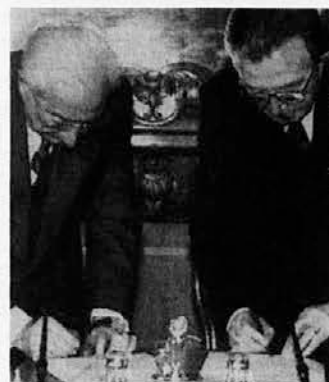
Predsednika Cossiga in Andreotti podpisujeta odlok o razpustu parlamenta.

Objavljen je bil spored obiska papeža Janeza Pavla II. v Furlaniji Julijski krajini. Začel se bo v četrtek, 30. aprila, s prihodom na letališče v Ronkah, od koder bo v spremstvu šel v Oglej. Tu se bo papež srečal s škofi iz Treh Benečij, Koroške, Slovenije in Hrvaške. Naslednji dan bo papež najprej v Pordenonu, nato pa bo zvečer prispel na Tržaško. Najprej se bo ustavil na Vejni, od koder bo nadaljeval pot do cerkve sv. Justa v Trstu. Naslednji dan, to je 2. maja, bo papež maševal na Velikem trgu v Trstu in nadaljeval pot v Gorico. Zadnji dan bo v Vidmu, kjer bo med drugim maševal na stadionu Friuli.