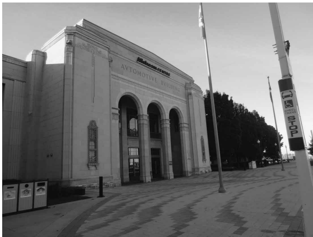
Center Automotive, prizorišče konference IHRA v Torontu. Kompleks je delo kanadskega arhitekta Douglasa Kertlanda in je bil zgrajen leta 1929.

V Torontu je med 6. in 10. oktobrom 2013 potekala mednarodna konferenca IHRA (Mednarodnega zaveznitva za raziskovanje holokavsta). 1 Iz Slovenije sva se je udeležila Eva Tomič (MZZ) in Vojko Kunaver (MIZŠ). Zaradi prilagajanja programu sva bila, podobno kot mnogi drugi udeleženci na konferenci, navzoča le med 8. in 10. oktobrom 2013.