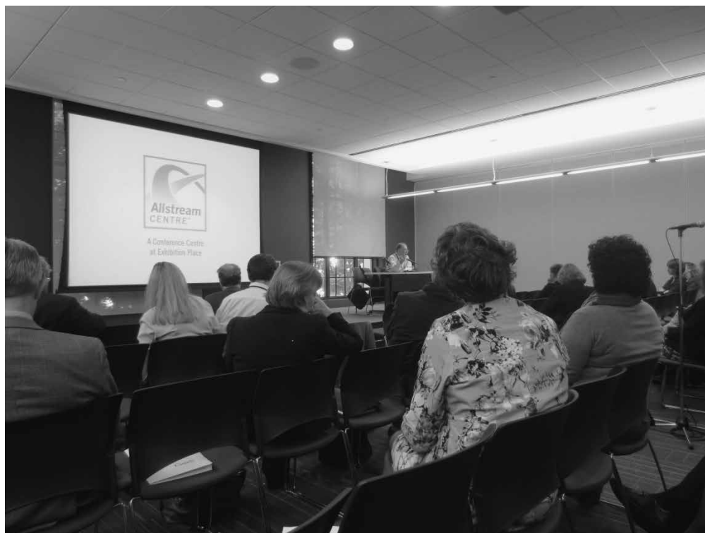
Predavanje prof. dr. Jehude Bauerja iz Izraela.

Prav tako smo v popoldanskem delu razpravljali tudi o »zanikanju holokavsta«. Ta tematika se kot stalnica pojavlja na vseh konferencah IHRA, kar pomeni, da je temu vprašanju namenjena posebna pozornost. Poslušali smo dokaj kritično razpravo glede sovraštva in novega antisemitizma na Madžarskem. Madžarska si namreč prizadeva, da bi že drugič prevzela predsedovanje IHRA v letu 2015. Predstavniki Madžarske so v svoji dokaj obsežni predstavitvi z grafi nakazali tudi trende v obnašanju do judovske skupnosti v tej državi. Ta država namreč vsako leto pripravlja poročila o tej problematiki tudi za OVSE. Razprava okoli tega je bila precej burna, še vedno pa ni razrešen tudi problem postavitve muzeja na eni od železniških postaj v Budimpešti, od koder so največ Judov odpeljali v Auschwitz.