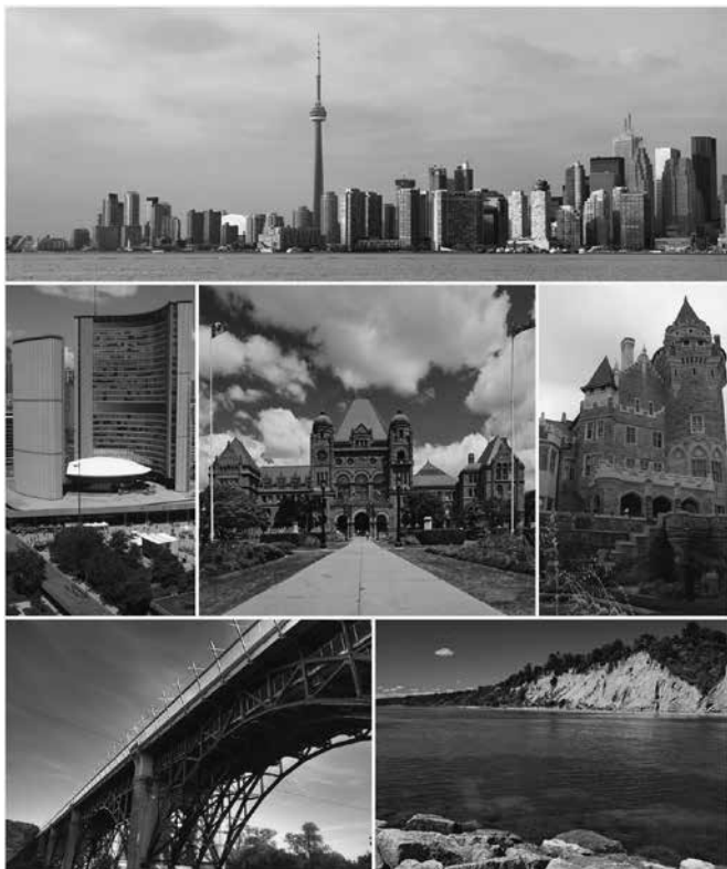
Toronto, največje mesto v Kanadi in peto največje mesto v Severni Ameriki.

Konferenco IHRA v Torontu lahko ocenim kot uspešno nadaljevanje prizadevanj za to, da se vsem, še zlasti pa mladi generaciji, približa tematika holokavsta. Ta naj bo v svojem izhodišču namenjena preprečevanju vseh vrst zločinov proti človečnosti, ki se žal še vedno dogajajo v različnih delih sveta. Naj ob koncu izrečem vse pohvale prizadevnim kanadskim organizatorjem in gostoljubju, ki smo ga bili kot gostje konference deležni na vsakem koraku.