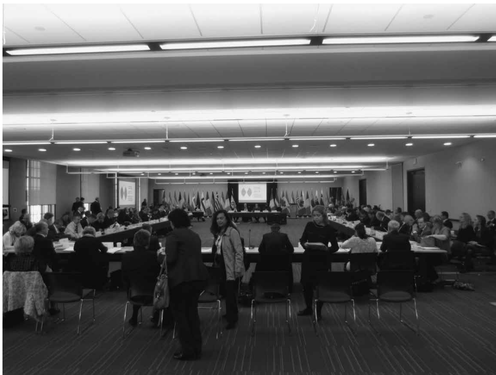
Plenarna konferenca IHRA v Torontu dne 10. 10. 2013.