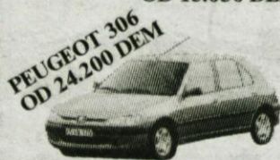
PEUGEOT 306 OD 24.200 DEM

POSEBNO UGODNE CENE ZA MODELE NA ZALOGI!