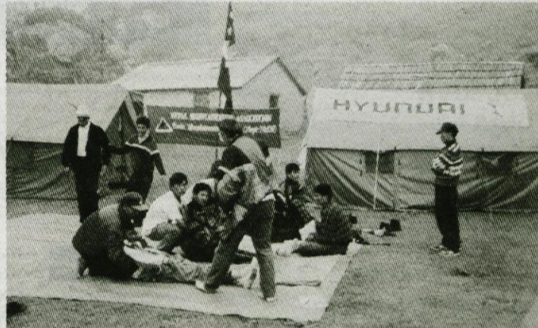
Lani nam je uspelo dobiti generalnega sponzorja, ki je pokril večji del stroškov. Zato je njegov napis visel v baznem taboru. Sprejaj tečajniki izvajajo vaje iz prve pomoči.