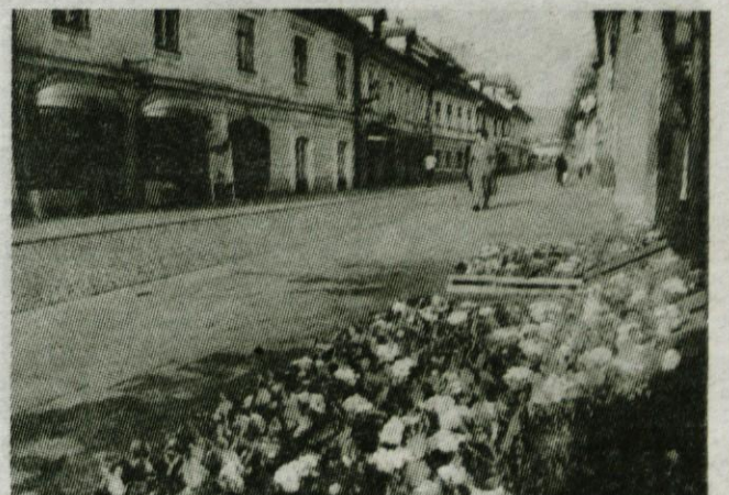
NA ŠUTNI NAMESTO SNEGA POMLADNO CVETJE - Namesto kupov snega, kot bi se za običajno zimo spodobilo, so sredi starega mesta cvetele primule, ceprav le pred cveticarno, pa vendar... (fs)