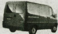
PEUGEOT BOXER OD 27.400 DEM