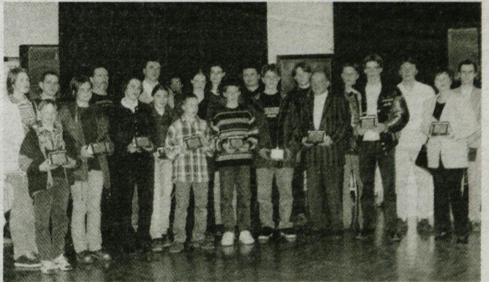
S podelitve priznanj Občinske športne zveze Kamnik najboljšim športnikom naše občine za leto 1997.