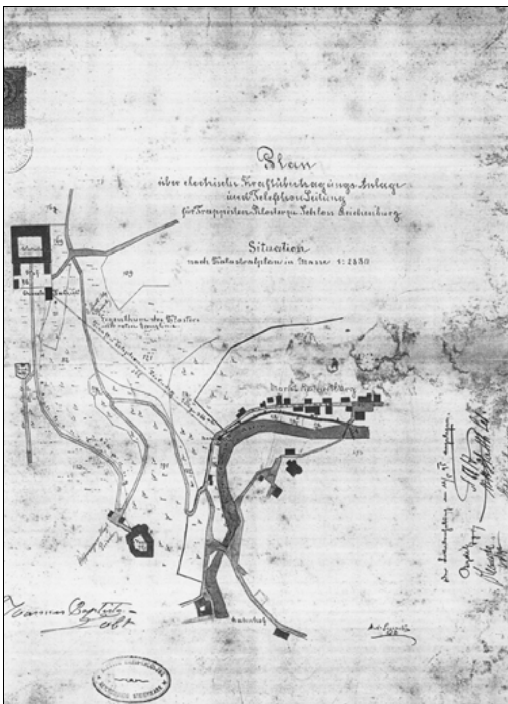
Načrt električne in telefonske napeljave (foto: Arhiv ZVKDS, OE Celje, 1998).

gato členjena fasada je jasno razvidna na kopiji načrta, ki je v arhivu ZVKDS, OE Celje in na fotografijah, ki jih je za potrebe stalne razstave o življenju in delu trapistov zbrala kustosinja Irena Fürst.