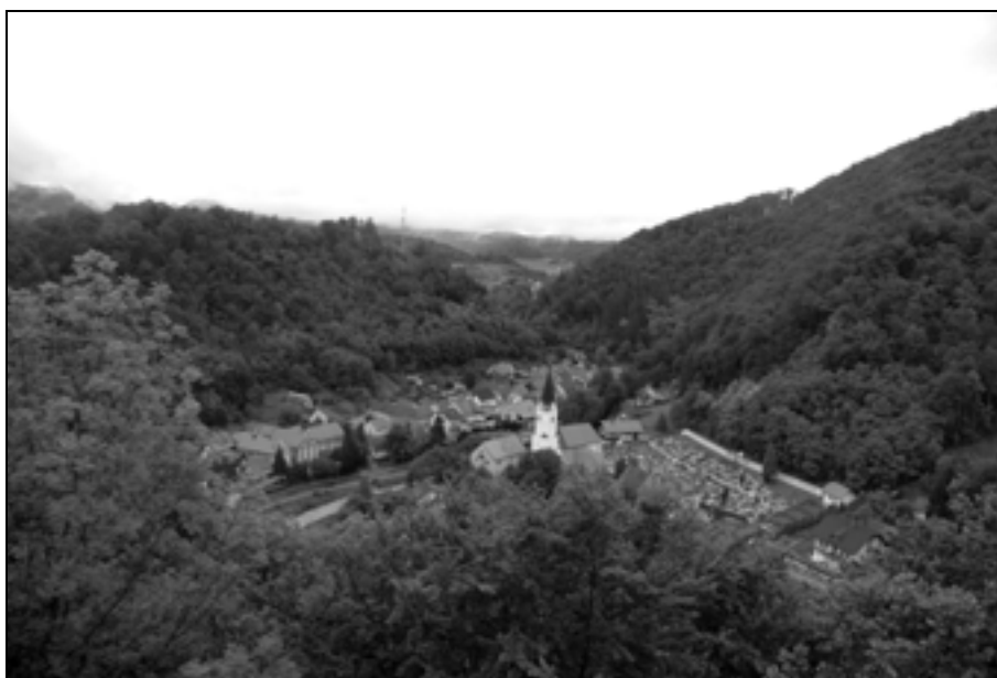
Pogled z gradu na trško jedro in cerkev sv. Petra in Pavla (foto: P. J. Babič, junij 2012).