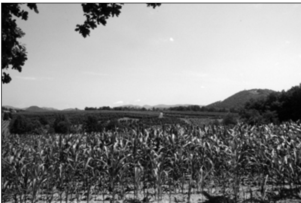
Zahodni del kulturne krajine z vidnimi strešinami pristaov v središču (foto: P. J. Babič, junij 2012).