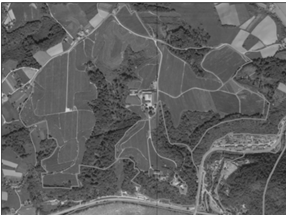
GisKD, posnetek sedanjega stanja iz Registra nepremične kulturne dediščine (Ministrstvo za kulturo, INDOK).