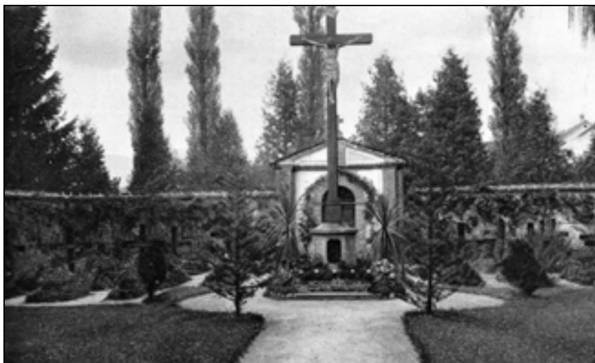
Samostansko pokopališče.

Žal je območje Rajhenburga eno tistih, ki imajo zaradi dolgega obdobja zanemarjanja in uničevanja malo ostalin. Ob prebiranju dosegljivih skromnih virov ne dvomimo o resničnosti vrtno zasnovalca. Izvedena ureditev predgradja, ponovno vzpostavljen most in parkirišče zato nujno potrebujeta izvedbo ustrezne povezave z dvignjenim delom zahodno od gradu (glej franciscejski kataster). Realna se zdi tudi revitalizacija radialno oblikovanega okrasnega vrta na platoju. Plato je dostopen po novem stopnišču ob Moserjevi hiši, pri čemer je bil saniran le del obstoječega kamnitega podpornega zidu.