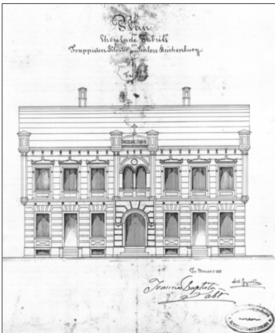
Izris fasade tovarne čokolade (foto: Arhiv ZVKDS, OE Celje, 1998).