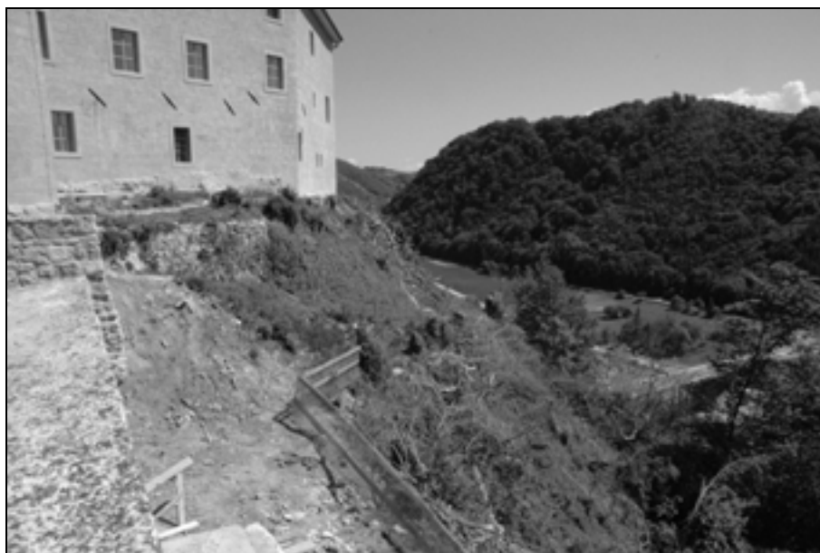
Del izčiščenega pobočja (foto: P. J. Babič, maj 2012).

Ob delih smo želeli izvedeti, do kolikšne mere so bila pobočja v preteklosti dejansko kultivirana oziroma potrditi predpostavko, da so bile terase zasajene z vinsko trto in sadnim drevjem, kot pri Sevnškem gradu. Kratek čas izvedbe del in izredna strmina sta potrdila obstoj dveh zidov. Žal je bila zaradi zaraščenosti izdelava ocene njunega stanja praktično nemogoča.