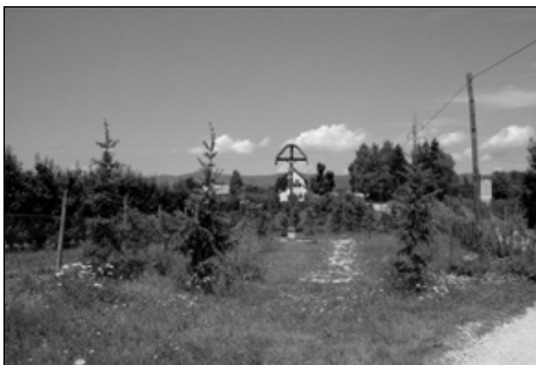
Spominsko obeležena lokacija nekdanjega pokopališča (foto: P. J. Babič, maj 2012).