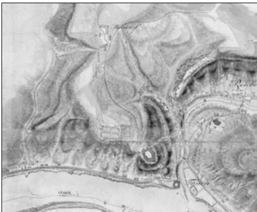
Scherowitzsov zemljevid Save iz leta 1807, izsek (Arhiv Republike Slovenije).