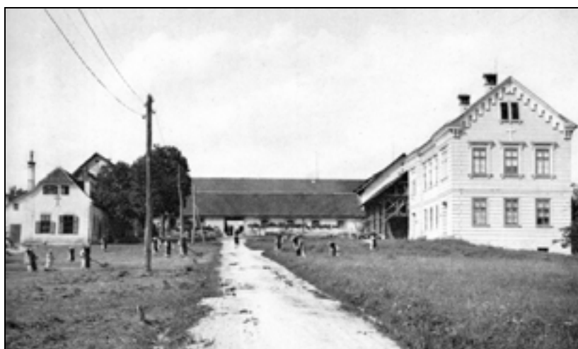
Menihi pri delu pred gospodarskimi poslopji (foto: Arhiv MNZS, Enota Brestanica, 1998).