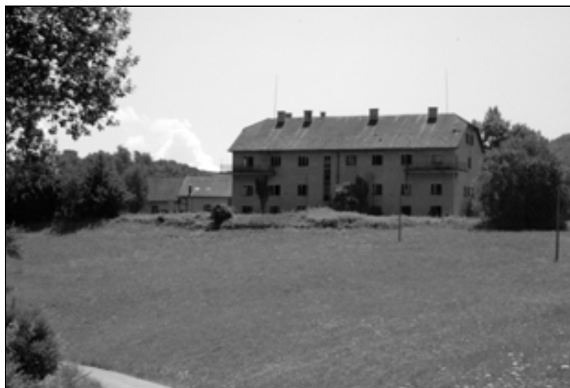
Lokacija zeliščno-zelenjavnega vrta z zapuščenim in propadajočim objektom (foto: P. J. Babič, maj 2012).

Zagotovo pa je potrebno vzpostaviti mehanizme za redno vzdrževanje v smislu sprotnega čiščenja zarasti. V nasprotnem primeru bo vegetacija v zelo kratkem času ponovno prikrila vedute na grad.