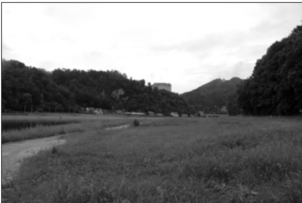
Pogled na grad iz doline Save (foto: P. J. Babič, junij 2012).

Današnja intenzivna raba kmetijskega prostora deluje, v primerjavi s peštrim krajinskim vzorcem v času trapistov, monotono. Čeprav je ambientalno ravnotežje med naravnimi in grajenimi prvini v obeh primerih prisotno, je vsebinska, funkcionalna, likovna in prostorska povezanost med sestavinami prostorske kompozicije in stavbami iz časa trapistov primernejša za delovanje celote. Zato je potrebno razmišljati o ponovni vzpostavitvi pestrega krajinskega vzorca, med drugim z zasaditvijo sadovnjakov z uporabo starih, visokodebelnih sadnih sort. Do takrat moramo na strnjeno območje s strukturo sadjarske krajine gledati kot na zeleno cono, ki ni podlegla pritiskom urbanizacije.