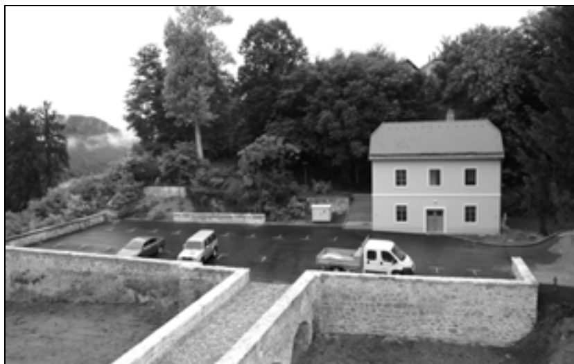
Zaraščen plato s propadajočo vrtno uto (foto: P. J. Babič, junij 2012).