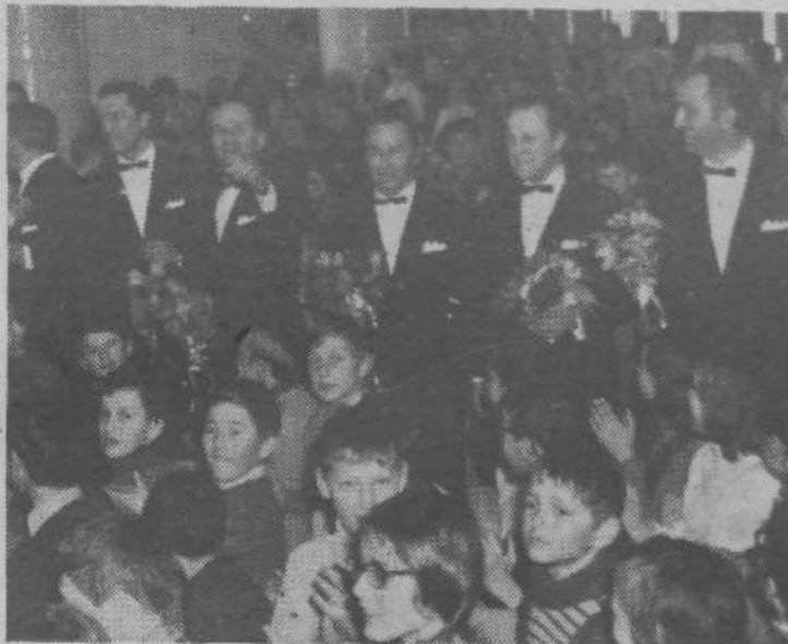
„Oktetovce“ so Poljski solarji sprejeli z velikim navdušenjem.

razpoloženje japonskih ribičev, teh dobrih, prijetnih ljudi! Zelo mi je ugajala tudi črna duhovna pesem, ki jo pojejo čmci, nesrečni, zatirani ljudje. V njej ni tiste prešerne ubranosti, ki napolnjuje srca japonskih ribičev, pač pa skrito trpljenje, otožnost, plahost, ki sijejo iz črnih, žalostnih oči preganjenih temnopolnih ljudi.