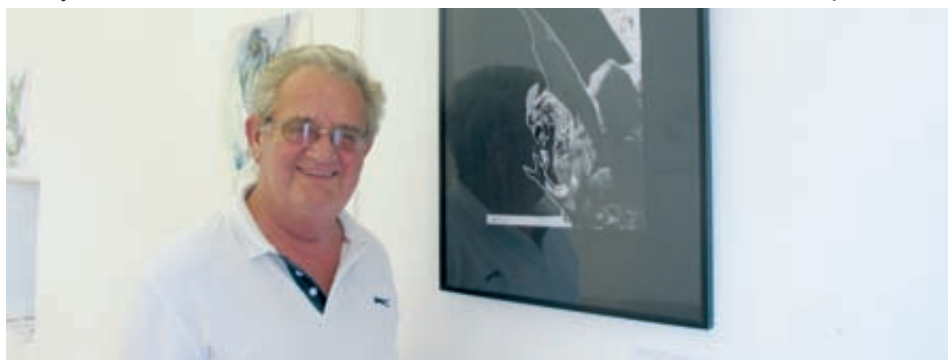
Istog Žorž.