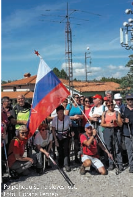
Po pohodu še na slovesnost.