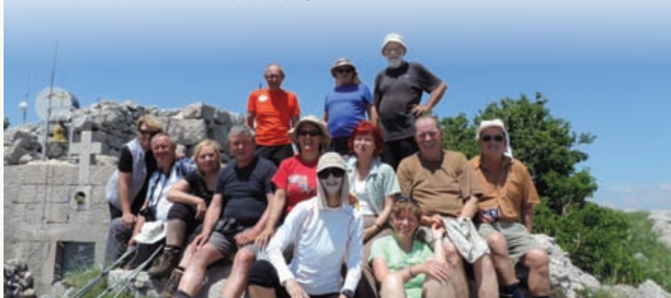
Na vrhu Snježnice.

Po vzponu na najvišji vrh Šipana v Elafitskih otokih pri Dubrovniku planinska skupina počasi končuje projekt vzponov na najvišje vrhove jadranskih otokov. Ostala je samo še Šolta.