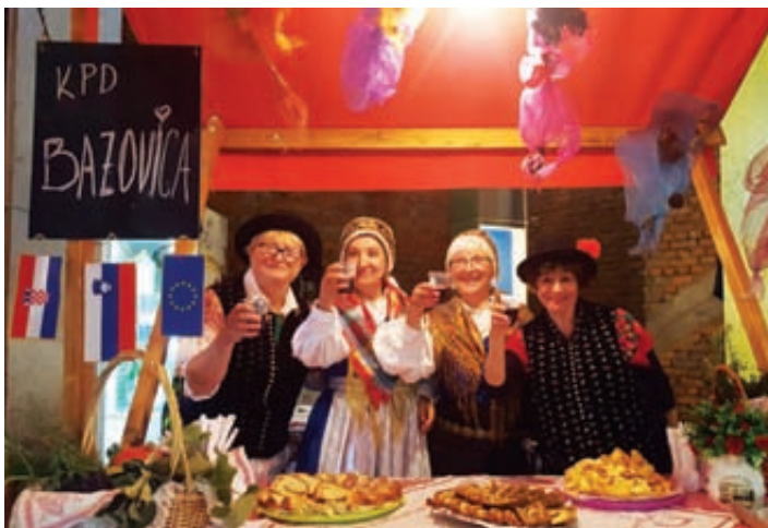
Bogata ponudba KPD Bazovica hitro pošla.