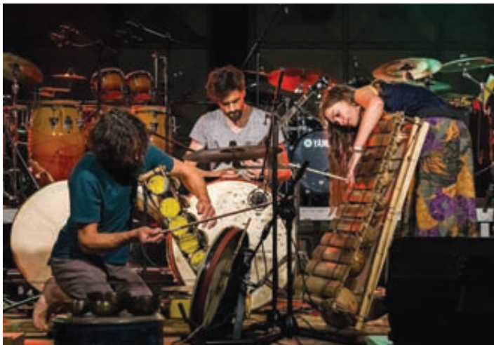
Skupina Širom.