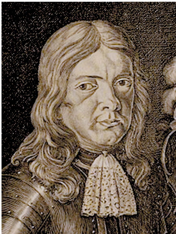
Portret Janeza Vajkarda Valvasorja (1641, Ljubljana – 1693, Krško). 4

Najprej strnjeno opišimo pomen izjemnega Janeza Vajkarda Valvasorja za kulturo in zgodovino Slovencev, danes tudi za državo Slovenijo. Bil je kranjski plemič, polihistor (torej poznavalec mnogih področij), član Kraljeve družbe (Royal Society) v Londonu (članstvo je prejel leta 1687 za uspešno razlago hidravlike presihajočega Cerkniškega jezera – to je bil izjemen dosežek – njegovo originalno študijo, model, sem si imel čast ogledati v Kraljevi družbi). Bil je vojak, boril se je proti Turkom in seveda tudi velik domoljub, ki je za svobodo in slavo svoje domovine (Slava vojvodine Kranjske) zastavil vse svoje premoženje, a na koncu obubožal.