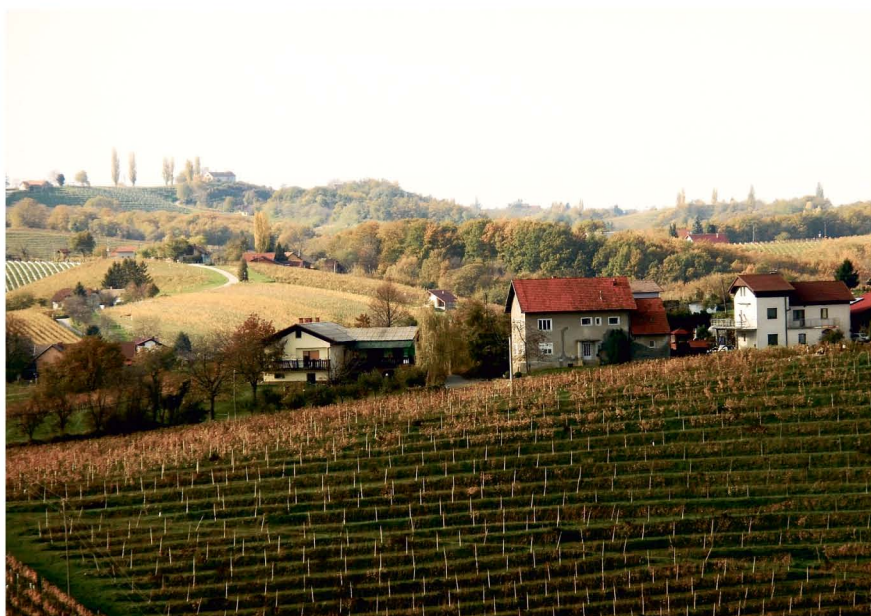
Kofler-Breznikova domačija, Kog, 2016.