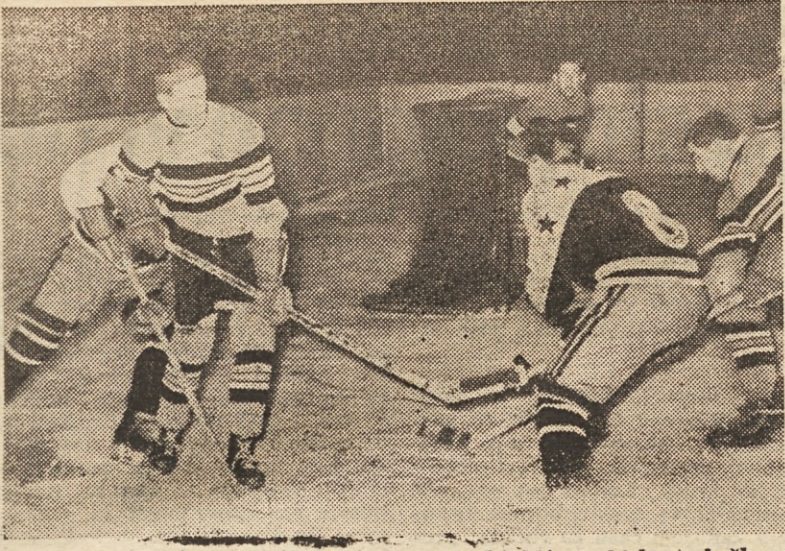
To je prizor iz dvoboja med Jesenicami in Ljubljano, ki bosta brzkone zasedla vrh lestvice

Zimo sem prebil bolj pri študiju in manj na treningu in prišlo je leto 1954, leto evropskega prvenstva v Bernu. V začetku sezone sem se, kar se je dalo, izogibal ovir in sem nastopal samo na 100 m. Šele 13. junija sem v Mariboru prvič pokleknil pred vrsto ovir.