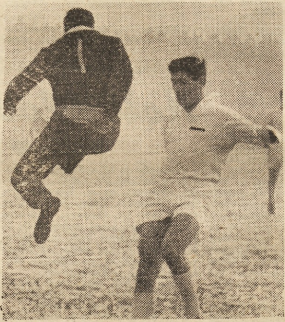
Odredovci v Ljubljani niso našli primerne telovadnice, zato so pričeli s treningi kar na prostem. Toda ta posnetek kaže prizor s tekme Odred : Rijeka, ki je bila zadnja v pretekli sezoni