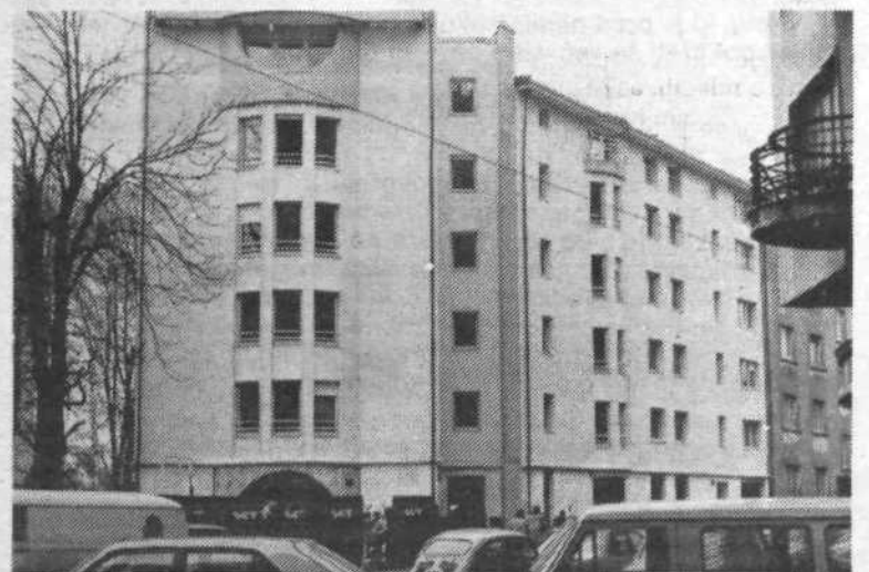
Novi bloki v Igriški ulici v Ljubljani dobivajo svojo končno podobo. Za njimi bodo začeli te dni graditi Igrišče, namenjeno predvsem učencem šole Majde Vrhovnik.

Na seji predsedstva bodo ocenili tudi uresničevanje vsebinske zasnove glasila Dogovori. O seji bomo podrobneje poročali v naslednji številki Dogovorov.