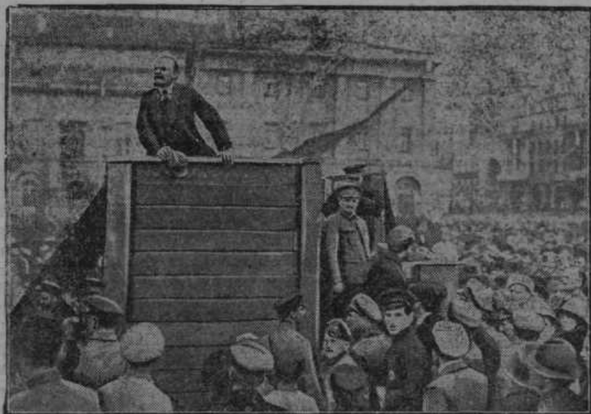
Slika iz prve dobe boljševiške revolucije je. Oče boljševizma — Lenin govori v Moskvi množicam.