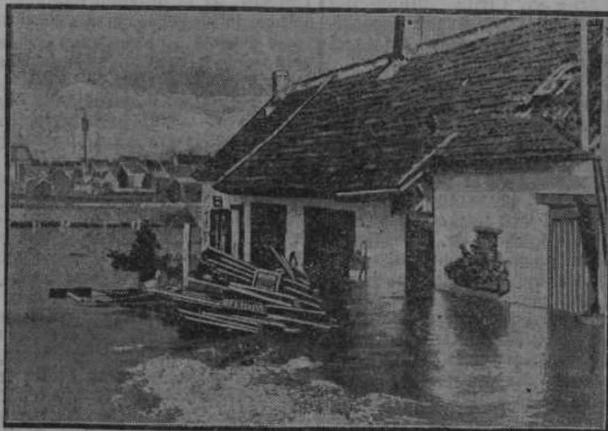
Povodenj v okolici belgijskega glavnega mesta Brüssel.