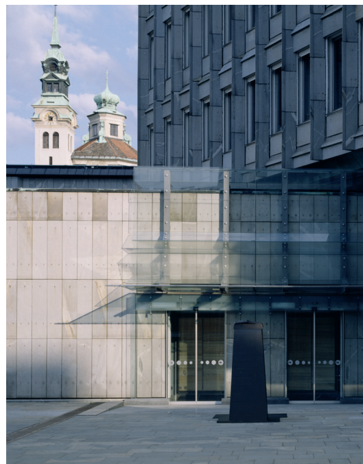
Stolpnica TR2, novi poslovni vhod