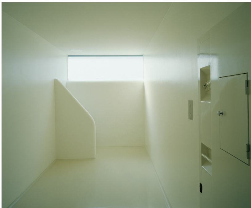
Policajska postaja Moste, celica za pridržanje