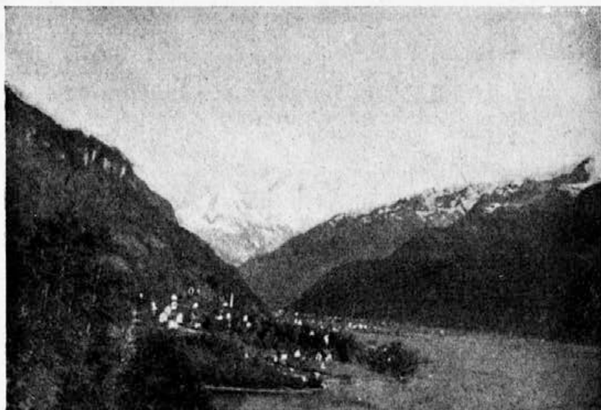
Flüelen v kantonu Uri

Čebelje bolezni. V Švici so razmeroma zelo pogostne razne čebelje bolezni, od njih tudi pršičavost. Zlasti je razširjena nose mavost, čeprav se proti njej bore na vse mogoče načine. Borbo proti čebeljim boleznim podpira Federalna vlada s sedežem v Bernu. Iz posebnega fonda, ki ga je vlada usta-