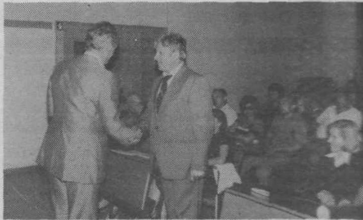
Plaketo sprejema predsednik sveta za preventivo in vzgojo v cestnem prometu mesta Ljubljana