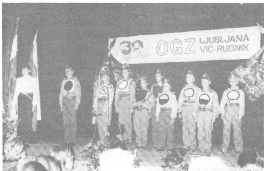
Ko smo opazovali iskren nastop mladih iškovarskih gasilcev, smo si želeli: da bi vsi ti fantje in dekleta tudi čez deset, petnajst let tako strumno stali v gasilski enoti in opravljali naloge, o katerih so odločno pripovedovali