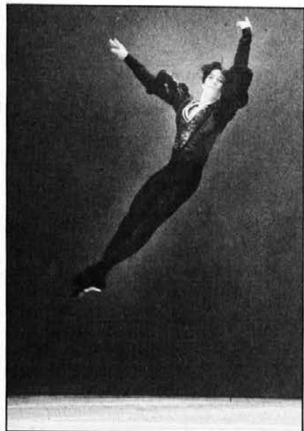
Gojenec Srednje baletne šole iz Maribora Jas Otrin

Peto jugoslovansko baletno tekmovanje (Novi Sad, 14. do 20. 1. 1991) je vnovič opozorilo na pomen te prireditve, ni pa predstavilo umetnikov, ki bi lahko posegli po najvišjem priznanju »Grand prix«.