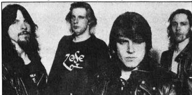
Glenn Danzig in njegova družina

plošča, ki bo izšla v naslednjih nekaj mesecih, razločen hommage zvoku nove Kalifornije. Ta zvok toliko bolj nedvoumno utemeljujejo njihovi losangeleški sosede Jane's Addiction , ki jih z Guns'n'Roses poleg podobno spornega narkomanskega naziva (Jane pomeni v tovrstnem slovarju heroin) družijo tudi vroče zanimanje za Led Zeppelin. Vseeno so za razliko od njih milje stran od klasičnega moško prenapetega hard rocka. Od Zeppelinov so odnesli predvsem njihovo zasanjano, psihedelično plat. Na svojih poteh in stranpoteh po bolj ali manj sončnih poljanah omame se srečujejo tudi s funkcom, z reggaejem, z glasbo bližnje latinske Amerike in eksotičnih azijskih dežel, pri čemer se z omenjenimi izrazi največkrat pogovarjajo daleč s svojih visoko lebdečih oblakov. Njihov pevec Perry Farrel, eden novih herojev generacije cvetja v letu 1990, je reden gost sanatorijev za premožnejše narkomane. Jane's Addiction gre posel vedno bolje od rok, vse od trenutka, ko so jih kot moderno losangeleško blago zapazili pri multinacionalni