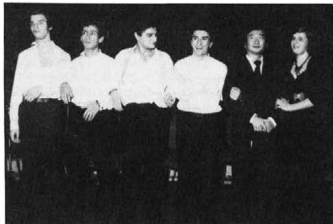
Najboljši na 38. violinskem tekmovanju N. Paganini '90

V Poznanu na Poljskem bo letos 10. mednarodno tekmovanje Henryka Wieniawskiego , ki je le vsakih pet let. Violinisti, stari največ 30 let, se lahko prijavitelj do 1. junija, tekmovanje pa bo potekalo od 9. do 23. novembra .