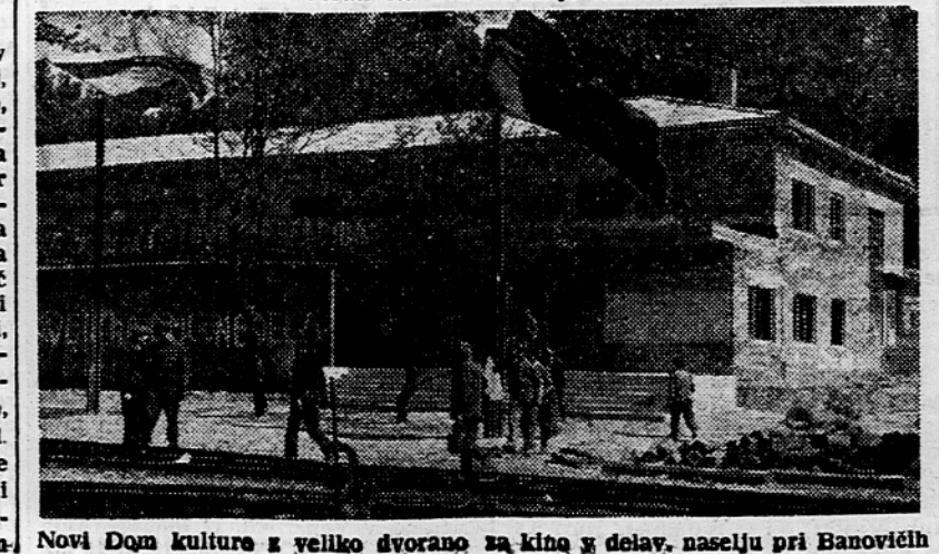
Novi Dom kulture v veliko dvorano za kino in delav. naselju pri Banovičih

Na področju Banovičev, kjer je stalo leta 1946. le nekaj primitivnih lesenih barak, imamo danes moderno opremljene »Rudnike premoga Titas« s sedmimi obrati. Med temi obrati sta dva velika dnevna kopa »Banovič« in »Omazič«, kjer kopljejo premog kar z bagri. V kratkem bodo končali priprave za odkritje tretjega največjega dnevnega kopa »Zivčič« ter novega velikega jamskega obrata »Radin Klana«. Leta 1947. zgrajeno separacijo v Zivinih bodo morali letos povečati za dvojno zmogljivost. Uprava rudnika je te dni prejela prve velike rudarske vagonete novega tipa za prevažanje, ki jih je začela izdelovati tovarna »Djuro Djakovič«. Ti vagoneti bodo omogočili hitrejši odvoz in boljše izkoriščanje lokomotiv. Prav tako je bano-