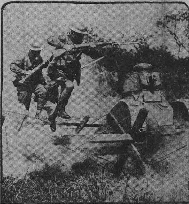
Na "Governor's Island" v New Yorku so nedavno priredili vojaške vaje, ki so predstavljale bitko pri Cantigny na Francoskem, izza časa svetovne vojne. Vojaki so naskakovali utrdbo in prodirali čez žične ovire.