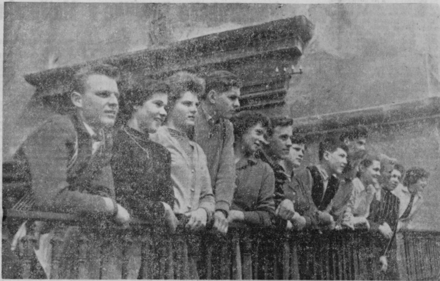
NJIHOV 1. MAJ JE NAJLEPSI

Ponosno vzhajajo zastave zmage delavskega razreda in vseh delovnih ljudi Jugoslavije.