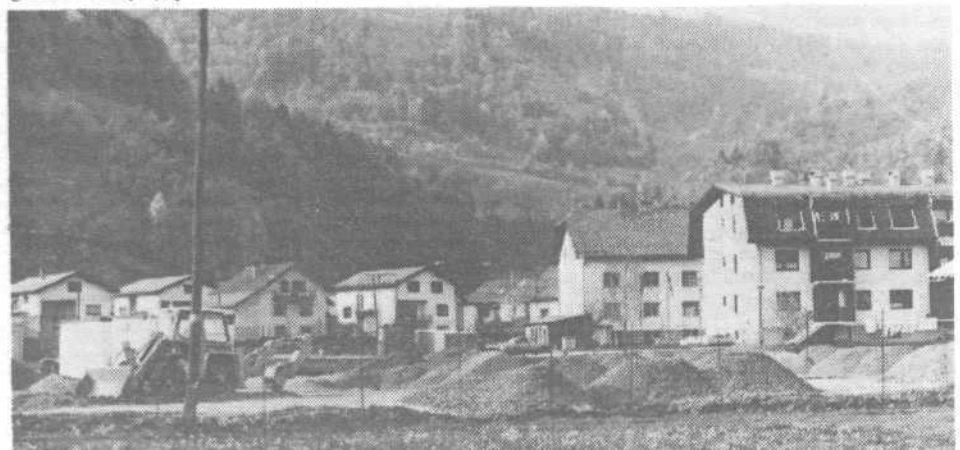
Novi del Horjula: komunala ima prednost

Kar nekaj Horjulčanov in krajanov sosednjih vasi že leta zama za telefonske priključke. PITT za letošnje leto končno objavlja novo telefonsko centralo v Horjulu in podcentralo v Sentoštu, s čimer naj bi pridobili, kot računajo, kakih 700 novih telefonskih priključkov. Kdaj pa bo PITT poskrbel za boljšo kakovost telefonskih vez (signal je često šibak, v slušalki se sliši tudi po več glasov hkrati ipd.), pa ni znano.