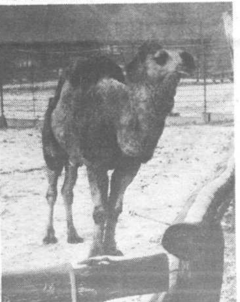
Zima v živalskem vrtu: kameli tudi mraz ne more do živega