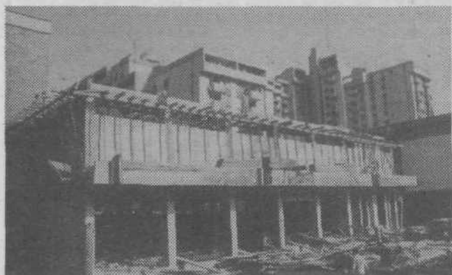
Moščanska tržnica je zgrajena do smrečice.