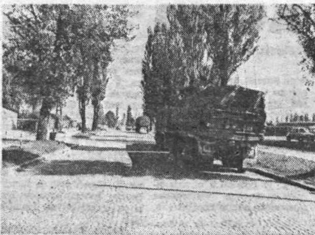
harjevi cesti (slika v sredini) in pred stadionom (slika na desni), onesnažujejo zrak v središču mesta in s hrupom cefrajo živce občanom. Koliko časa bo še edino zares lepo urejeno ljubljansko parkirišče za tovornjake še samevalo prazno?