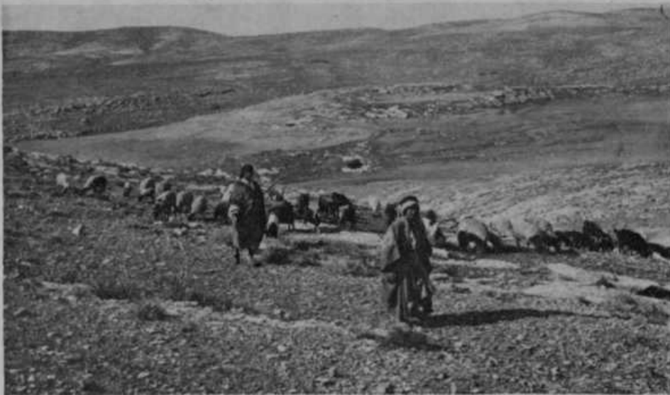
Današnji pastirji s čredami pri Betlehemu.

Slika nam predstavlja pokrajino, kjer so — prav tako kot še danes — pastirji v božični noči stražili svoje črede, ko jih nenadoma obsveti nebeška svetloba, pristopi angel k njim ter jim oznaní rojstvo Odrešenikovo. Množica angelov pa je prepevala: »Slava Bogu na višavah in na zemlji mir ljudem, ki so Bogu po volji.«