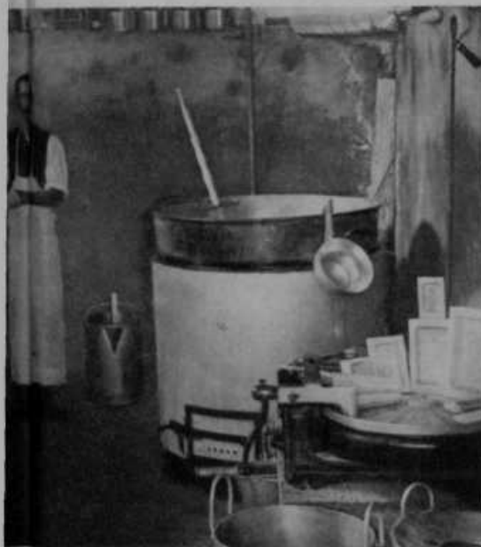
rdni Trojanah, ki je začela obratovati 30. avg. 1926.

Spodnja slika nam kaže strugo narasle Save, ki se je razlila čez celo dolino od enega pobočja do drugega. Proti koncu novembra se Sava še vedno ni umirila in stalno ogroža vse, kar je ob njenih bregovih.