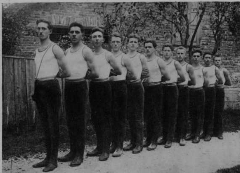
Telovadci orlovskega odseka v Dobu ob petletnici (1921—1926).

Kaj hoče orlovstvo? Gojiti v fantih: 1. telesno krepkost (zakaj narod telesnih slabičev je obsojen na smrt), 2. izobrazbo duha (zakaj narod, ki nič ne zna, postane in ostane suženj drugih), 3. čut skupnosti (zakaj ljudstvo, ki se ne nauči skup držati, nič ne doseže), 4. pošteno fantovsko družščino (zakaj mladina, ki ima smisel za alkohol in kvanto, pomenja žalosten pogin ljudstva).