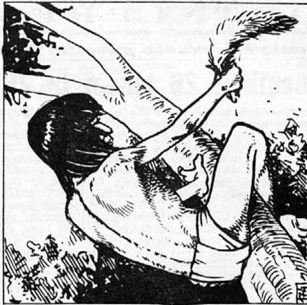
174. Počasi, palec za palec, je potegnil zver, ki mu je opletala v desnici kot utopljen šakal, k sebi na vejo. Potem je z levico segel po nož, odrezal vodniku košati rdečkasti rep in ga zagnal neazaj na zemljo. Z repom pa je izvalno in z smehljivo pomahal podvignanemu krdelu. Vedel je, da jih je sedaj prikoval na mesto.