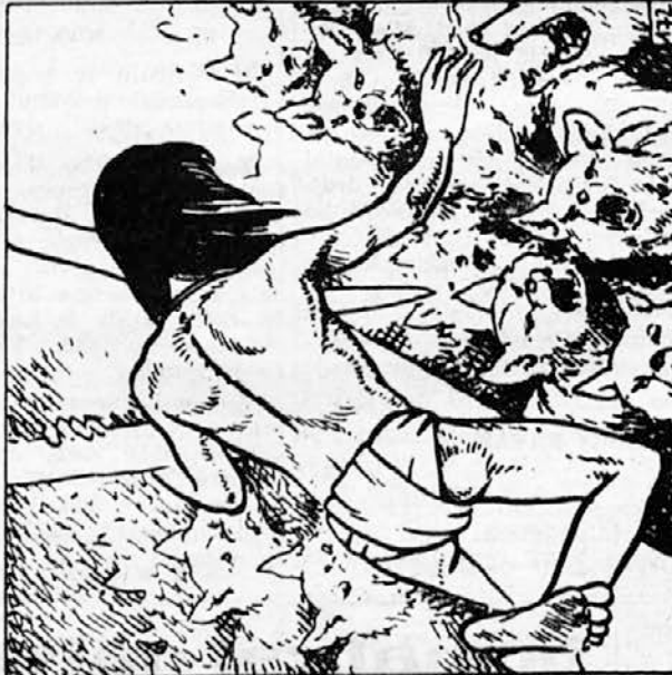
172. Volkovi so začeli skakati kvišku, da bi ga napadli. Mavgli se je z nogami tesno oklenil veje, desnico pa je sprostil, da bi lahko z njo vsak hip udaril. Marsikateri volk je že poskočil kvišku, a Mavgli ni hotel tvegati. Slednjic je pripravil vodnika do tolikšne besnosti, da se je pognal više kot vsi drugi.