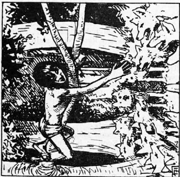
171. Legel je na vejo in se pritisnil z obrazom k lubju. Njegove psovke so postale vedno nujše. Doli še niso slišali bolj strupene in zbadljive govorice, kot je bila njegova. Počasi in premisljeno jih je razdražil od molka do renčanja, od renčanja do tuljenja in od tuljenja do hripave besnosti. Niti odgovarjati mu niso mogli.