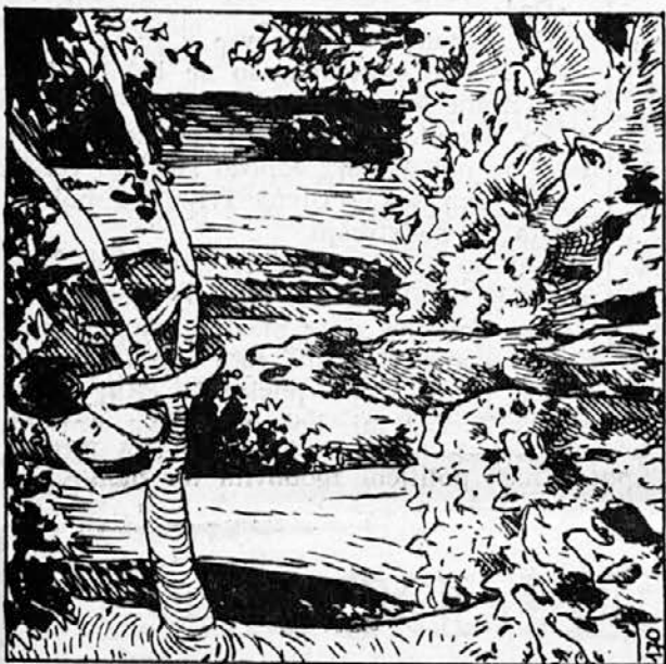
170. Doli, ki imajo dlako med prsti, so najbolj užaljeni, če jih kdo na ta račun izživa. Vodnik je poskočil in šavnil po Mavgljevih prstih, tu pa je bil hitrejši in je potegnil nogo kvišku. Tedanj je Mavgli začel nizati psovko na psovko: »Psi, rdeči psi, vrnite se v Dekan in žrite podganе! Med vsemi prsti vam raste dlaka!«