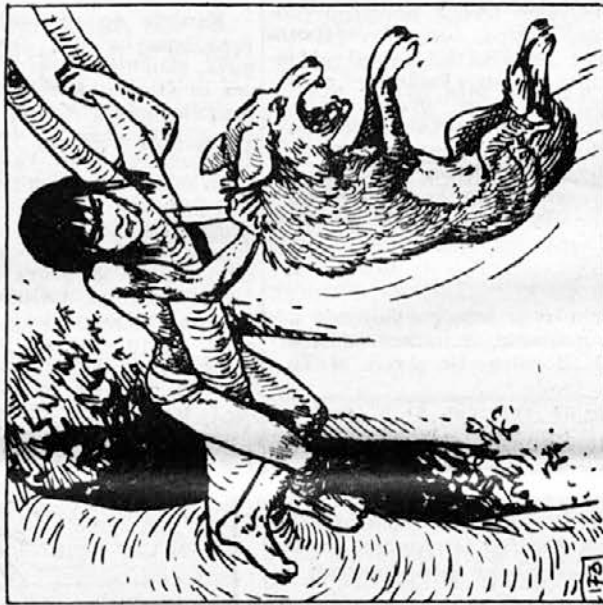
173. Besnost mu je podvojila sile in planil je kvišku sedem čevljev visoko. Tedaj pa ga je Mavgli s kačjo hitrostjo pograbil za tilnik. Veja se je stresla in upognila, ko je na njej obvisela tolikšna težava. Mavgli bi od sunka skoraj padel na tla, toda dola ni izpuštil. Se tesneje se je oklenil veje in stiskal kosmati tilnik.