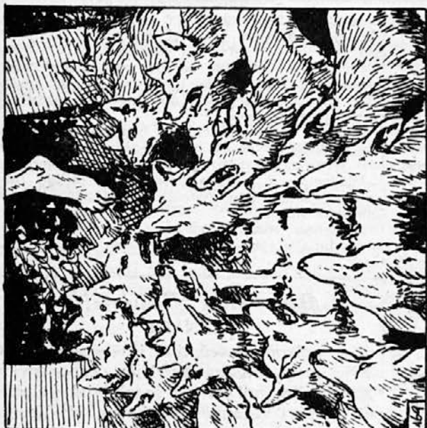
169. Dol je odprl krvavi gobec in pokazal bele zobe: »Vse džungle so naš džungle!« je zarezal. Mavgli pa jih je začel dražiti. Iztegnil je bosonogo in migal z golimi prsti ravno nad vodnikovo glavo. To je bilo dovolj, da je krdelo pod drevesom kar zbesnelo. Zasišlo se je sovražno renčanje.