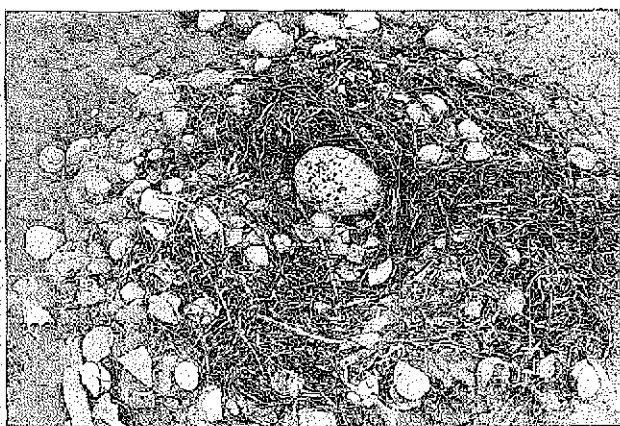
Sl. 3: Neizvaljeno jajce sabljark v gnezdu v Sečovljskih solinah.

Sodeč po datumu izvalitve sta bili jajci zleženi v prvih junijskih dneh (valjenje traja 24-25 dni), kar je na sredini iz literature znanega gnezditvenega obdobja od maja do julija. V obdobju graditve gnezda je bila gnezditvena peščina nedvomno otok, po vsej verjetnosti pa je bila v času graditve in valjenja tudi kdaj poplavljen, o čemer priča razmeroma visoko, najbrž sproti povisevano gnezdo. Toda če sta graditev gnezda in začetek valjenja za sabljarko nekaj povsem običajnega, pa česa takega ni mogoče trditi za asocialno gnezdenje in velikost legla. Sabljarka običajno gnezdi v kolonijah, posamezne gnezditve so sodeč po strokovni literaturi zelo redke, domača nepoznane. Tako so tudi legla s štirimi jajci skorajda pravilo, manjša legla, še posebno takšna z enim jajcem, pa pripisana nepravilnostim pri gnezdenju (Glutz von Blotzheim et al. , 1977). Mislim, da lahko oboje, tako asocialno gnezditve kot nizkoštevilsno leglo, nenazadnje pa tudi izvalitev enega samega mladiča, pripišemo mladostni neizkušenosti staršev. Sabljarka namreč spolno dozori šele v tretjem koledarskem letu življenja, pa še takrat ne celotna populacija, zato so v drugem koledarskem letu življenja pogostejše gnezditvene anomalije. Vendar propada mladiča ne gre pripisati izključno mladostni neizkušenosti, saj je gnezditveni uspeh sabljarko nasploh zelo majhen, še posebno tam, kjer v bližini domujejo galebi (Glutz von Blotzheim et al. , 1977).