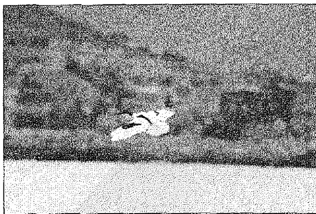
Sl. 1: Svarilni let sabljarka Recurvirostra avoetta nad Sečoveljskimi solinami.

Spomladi 2001 je osebka gnezditveno sumljivih sabljark in značilno hlinjenje večkrat opazoval Lovrenc Lipej ( ustno ).